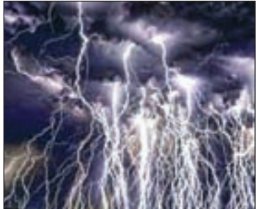
मानसून की आफत से राहत की संभावना कम लगती है। भारत मौसम विज्ञान विभाग

राष्ट्रीय खबर भुवनेश्वर: पिछले महीने हिमाचल और उत्तराखंड में मानसूनी बारिश के कारण हुई तबाही की यादें हमारे दिमाग में ताजा हैं, हम सभी जानते हैं कि सिस्टम परेशान होने पर कैसे परेशान होता है। और अब, दक्षिण-पश्चिम मानसून, जो अगस्त के अंत से काफी हद तक निष्क्रिय था, सप्ताहांत में बंगाल की खाड़ी के ऊपर एक चक्रवाती परिसंचरण द्वारा बुरी तरह से जागृत हो गया था।