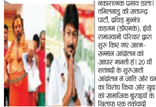
नवरात्रक प्रभाव डाला। तमिलनाडु की सत्तारूढ़ पार्टी, द्रविड़ मुन्नेत्र कडगम (डीएमके), डीवी रामास्वामी परिवार द्वारा शुरू किए गए आत्म-सम्मान आंदोलन को आधार मानती है।

डी एमके नेता और तमिलनाडु के युवा कल्याण मंत्री उदयनिधि स्टालिन के बयान में कहा गया है कि सनातन धर्म सामाजिक व्यवस्था के खिलाफ है और इसलिए इसे मिटा दिया जाना चाहिए, जिससे राजनीतिक विवाद हो गया है।