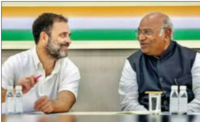
अधीर रंजन चौधरी ने कल ही अपना नाम वापस ले लिया था

नयी दिल्ली: कांग्रेस अध्यक्ष मल्लिकार्जुन खड़गे तथा पूर्व अध्यक्ष राहुल गांधी ने मोदी सरकार के एक राष्ट्र एक चुनाव के विचार को देश में लोकतंत्र एवं संघीय ढांचे की व्यवस्था को खत्म कर तानाशाही लाना है। श्री खड़गे ने एक राष्ट्र एक चुनाव के विचार को देश में लोकतंत्र खत्म कर संघीय व्यवस्था को तानाशाही में तब्दील करने का प्रयास बताया है जबकि श्री गांधी ने इस विचार को खारिज करते हुए इसे राज्यों पर हमला करार दिया और कहा कि सरकार का यह कदम पूरी तरह से संघीय प्रणाली के विरुद्ध है। श्री गांधी ने कहा, एक राष्ट्र एक चुनाव का विचार संघ और उसकी सभी राज्यों पर हमला है। श्री खड़गे ने कहा, मोदी सरकार का मकसद लोकतंत्र को धीरे-धीरे