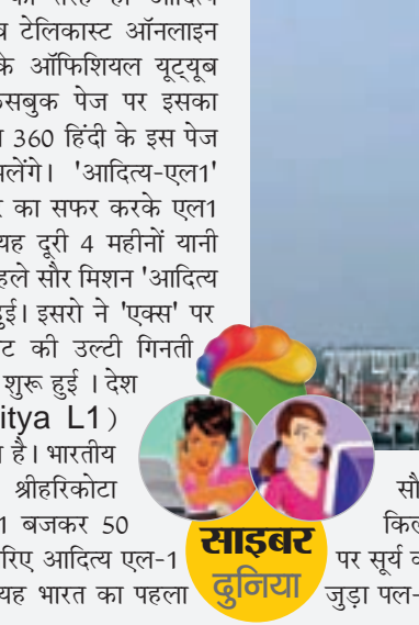
साइबर दुनिया सौर मिशन है, जो पृथ्वी से करीब 15 लाख किलोमीटर दूर एल1 पॉइंट (सूर्य-पृथ्वी लैंग्रेंज बिंदु) पर सूर्य को मॉनिटर करेगा। आदित्य एल-1 को लॉन्चिंग से जुड़ा पल-पल का अपडेट हम आप तक पहुंचाएंगे।

नई दिल्ली: चंद्रयान-3 मिशन की तरह ही आदित्य एल1 मिशन का भी लाइव टेलिकास्ट ऑनलाइन देखा जा सकेगा। इसरो के ऑफिशियल यूट्यूब चैनल, वेबसाइट और फेसबुक पेज पर इसका लाइव टेलिकास्ट दिखाया जाएगा। गैजेट्स 3.60 हिंदी के इस पेज पर भी आपको लाइव अपडेट्स मिलेंगे। 'आदित्य-एल1' स्पेसक्राफ्ट पृथ्वी से 15 लाख किलोमीटर का सफर करके एल1 (सूर्य-पृथ्वी लैंग्रेंज बिंदु) पर पहुंचेगा। यह दूरी 4 महीनों यानी करीब 120 दिनों में पूरी होगी। भारत के पहले सौर मिशन 'आदित्य एल1' के लॉन्च की उल्टी गिनती शुरू हुई। इसरो ने 'एक्स' पर शेयर की जानकारी। 23 घंटे 40 मिनट की उल्टी गिनती शुक्रेवार दोपहर 12 बजकर 10 मिनट पर शुरू हुई। देश का पहला सूर्य मिशन 'आदित्य' (Aditya L1) शनिवार 2 सितंबर को लॉन्च होने जा रहा है। भारतीय स्पेस एजेंसी 'ISRO' आंध्र प्रदेश के श्रीहरिकोटा स्पेसपोर्ट से इसे रवाना करेगी। सुबह 11 बजकर 50 मिनट पर पीएसएलवी-सी57 रॉकेट के जरिए आदित्य एल-1 स्पेसक्राफ्ट को मिशन पर भेजा जाएगा। यह भारत का पहला