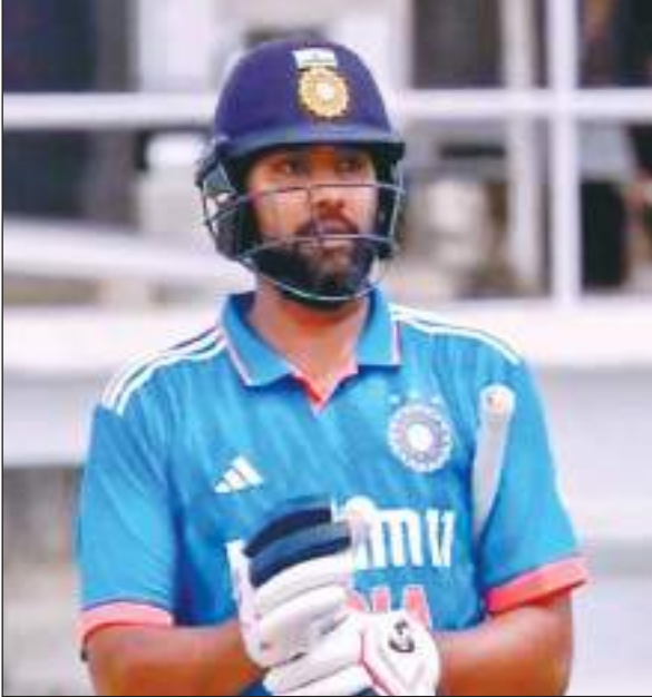
भारत के खिलाफ अपनी 12 मैचों की हार का सिलसिला समाप्त कर दिया है। जिसके बाद उन्हें लगता है कि उनके

नई दिल्ली: एशिया कप 2023 शुरू होने में अभी कुछ समय शेष है। लेकिन उससे पहले ही पाकिस्तान के पूर्व कप्तान वकार युनुस ने रोहित शर्मा और भारतीय टीम को चेतावनी दे दी है। दरअसल, वकार ने क्रिकेट पाकिस्तान के साथ बात करते हुए कहा कि नई पाकिस्तानी टीम पिछली टीमों की तुलना में बेहद मजबूत है। पाकिस्तान ने 10 विकेट से हराकर वर्ल्ड कप 2021 में