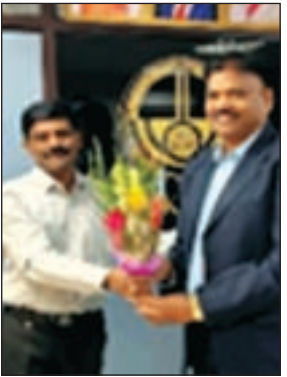
आयोजन सचिव श्रीमती

दुर्गापुर : २९ अगस्त को, सीएआरआई, कोलकाता के सेमिनार हॉल में रसायन विज्ञान विभाग द्वारा गुणवत्ता और प्रामाणिकता का पता लगाने के लिए बहु-सामग्री (एएसयू)/आयुष आहार के जटिल वनस्पति के लक्षण वर्णन के लिए रणनीति और दृष्टिकोण पर एक दिवसीय मंथन सत्र आयोजित किया गया था। कार्यक्रम की शुरुआत दीप प्रज्वलन के साथ की गई और