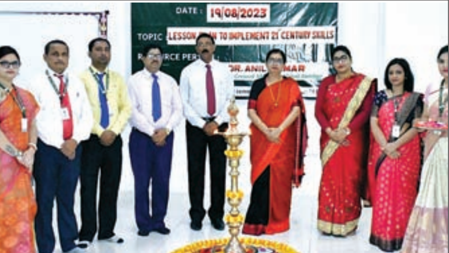
यह पता लगाना चाहिए कि विद्यार्थियों को क्या पसंद है और क्या चीज उन्हें प्रभावित करती है।