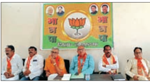
जनसभा कार्यक्रम को लेकर भाजपा जिला कार्यालय में भाजपा

राष्ट्रीय खबर कुड़ु: भारतीय जनता पार्टी लोहरदगा जिला की बैठक 22 अगस्त 2023 दिन मंगलवार को आगामी 19 सितंबर 2023 को झारखंड के प्रथम मुख्यमंत्री बीजेपी के झारखंड प्रदेश अध्यक्ष बाबूलाल मरांडी आगमन संकल्प यात्रा के निमित्त 18 सितंबर को होगी और 19 तारीख को समहरणालय मैदान में आयोजित