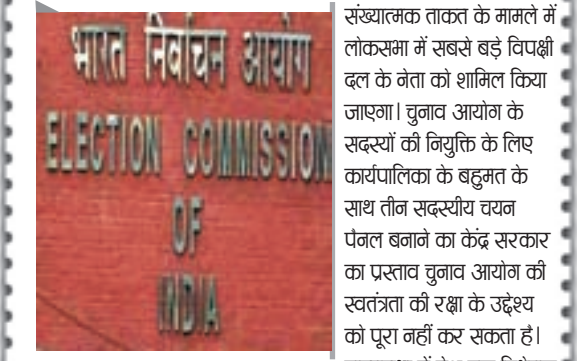
संख्यात्मक ताकत के मामले में लोकसभा में सबसे बड़े विपक्षी दल के नेता को शामिल किया जाएगा। चुनाव आयोग के सदस्यों की नियुक्ति के लिए कार्यपालिका के बहुमत के साथ तीन सदस्यीय चयन पैनल बनाने का केंद्र सरकार का प्रस्ताव चुनाव आयोग की स्वतंत्रता की रक्षा के उद्देश्य को पूरा नहीं कर सकता है। राज्यसभा में पेश एक विधेयक

रेंद्र मोदी की पंचदं बहुमत की सरकार क्या अफसरों के सहारे चल रही है। यह सवाल इसलिए प्रासंगिक है क्योंकि दिल्ली बिल के बाद अब चुनाव आयोग की नियुक्ति पर नया विधेयक पेश किया गया है। सरकार में राज्यसभा में एक विधेयक पेश किया जिसमें मुख्य चुनाव आयुक्त और चुनाव आयुक्तों के चयन के लिए समिति में भारत के मुख्य न्यायाधीश के स्थान पर प्रधानमंत्री द्वारा नामित एक कॅबिनेट मंत्री को शामिल करने का प्रावधान है। यह लोकसभा में विपक्ष के नेता को भी चयन समिति का सदस्य बनाता है। यह सुप्रीम कोर्ट के फैसले के पांच महीने बाद आया है कि प्रधान मंत्री की अध्यक्षता में एक तीन सदस्यीय पैनल, जिसमें लोकसभा में विपक्ष के नेता और भारत के मुख्य न्यायाधीश शामिल होंगे, सीईसी और ईसी का चयन तब तक करेंगे जब तक कि कोई कानून नहीं बन जाता। सीईसी और ईसी की नियुक्ति के लिए एक स्वतंत्र तंत्र की मांग करने वाली याचिकाओं पर फैसला चुनावों के पांच-न्यायाधीशों की संविधान पीठ ने यह भी कहा कि जहां कोई विपक्ष का नेता उपलब्ध नहीं है, समिति में