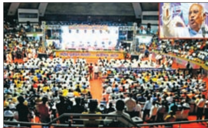
मणिपुर जल रहा है लेकिन प्रधानमंत्री चुप हैं:खडगे

नयी दिल्ली: कांग्रेस अध्यक्ष मल्लिकार्जुन खडगे ने प्रधानमंत्री नरेंद्र मोदी पर निशाना साधते हुए कहा है कि जब वह पूछते हैं कि कांग्रेस ने इस देश को क्या दिया तो इसका सीधा जवाब यही है कि कांग्रेस ने 70 साल से लोकतंत्र बचाए रखा इसलिए श्री मोदी देश के प्रधानमंत्री बन पाए हैं। श्री खडगे ने गुरुवार को यहां तालकटोरा स्टेडियम में आयोजित महिला कांग्रेस के राष्ट्रीय सम्मेलन 'प्रतिज्ञा उज्वल भारत की' के पदाधिकारियों को संबोधित करते हुए कहा श्री मोदी बार बार सवाल करते हैं कि कांग्रेस ने 70 साल में क्या किया जबकि इस दौरान और कई दलों की सरकार रही है लेकिन वह कांग्रेस से ही अक्सर सवाल पूछते हैं। उन्होंने कहा मोदी जी बोलते हैं- कांग्रेस ने 70 साल में क्या किया। हमने