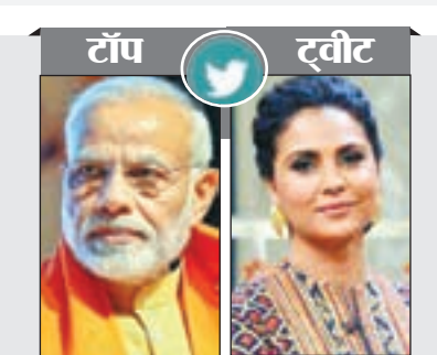
नरेंद्र मोदी प्रधानमंत्री

बिक गया। इसके लिए एप्पेजॉन को देश भर से ऑर्डर्स मिले थे। इससे यह पता चलता है कि 10,000 रुपये से 15,000 रुपये की प्राइस रेंज में इसकी बड़ी संख्या में बिक्री हो रही है। Redmi 12 5G में प्रोसेसर के तौर पर Qualcomm Snapdragon4 Gen2 SoC दिया गया है। इसके 6 GB + 128 GB वेरिएंट का प्राइस 12,499 रुपये और 8 GB + 256 GB का 14,499 रुपये है। कंपनी ने अपने Note 12 Pro 5G को नए स्टोरेज और फ्लैट कन्फिगरेशन के साथ भारत में लॉन्च किया है। इस वर्ष की शुरुआत में यह स्मार्टफोन भारत में 6 GB RAM + 128 GB स्टोरेज, 8 GB RAM + 128 GB स्टोरेज और 8 GB RAM + 256 GB वेरिएंट्स में लॉन्च किया गया था। इस स्मार्टफोन का नया वेरिएंट 12 GB के RAM और 256 GB की स्टोरेज के साथ है।