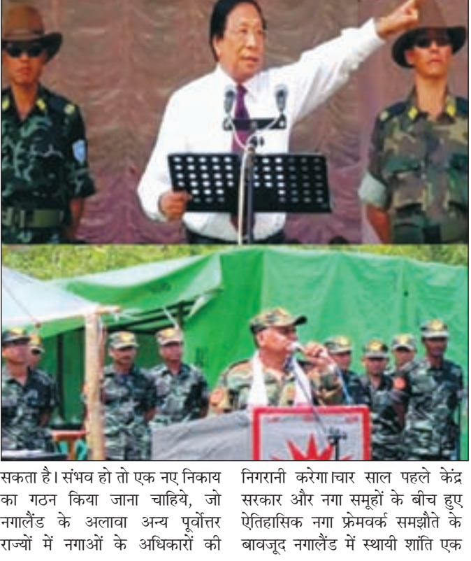
सपना जैसी बनी हुई है। केंद्र सरकार ने यह समझौता नेशनल सोशलिस्ट काउंसिल ऑफ नगालैंड (एनएससीएन) के नेता इसाक-मुइवा के साथ किया था, जिसमें अन्य विद्रोही गुटों का प्रतिनिधित्व भी था। लेकिन ऐसी कई वजहें हैं, जिनसे इस समझौते से केवल निराशा हाथ लगी है। 1826 में अंग्रेजों ने असम को ब्रिटिश भारतीय साम्राज्य में मिला लिया तथा 1881 में नगा हिल्स भी इसका हिस्सा बन गया। 1946 में अंगामी जापू फिजो के नेतृत्व में नगा नेशनल काउंसिल का गठन किया गया, जिसने 14 अगस्त, 1947 को नगालैंड को एक स्वतंत्र राज्य घोषित किया। परिषद मुख्यालय (सीएचक्यू), हेब्रोन में आयोजित 77 वें नगा स्वतंत्रता दिवस समारोह के अवसर पर, एटो किलोनसर, इनो टी मुइवा ने संप्रभुता, ऐतिहासिक संघर्षों और नगाओं के लिए स्वतंत्रता की खोज के महत्व पर जोर देते हुए एक भाषण दिया। नगालिम पर भारतीय आक्रमण के काले दौर को संबोधित करते हुए, अतो