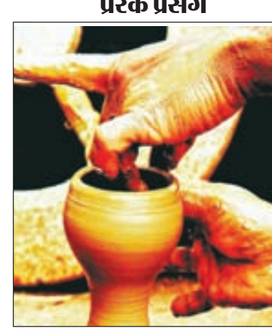
होते हैं। एसा कहकर देवता अदृश्य हो गया, और कुम्हार की भी नींद

एक कुम्हार चिलम बनाया करता था, एक बार वह किसी तीर्थ स्थान पे गया, पूजा आराधना श्रद्धापूर्वक किया, फिर शकान मिट्टाने के लिए पास में ही रखी एक चौकी पे सो गया। कुम्हार ही नींद में एक सपना आया जिसमें एक देवता उससे पूछ रहे थे की तुम क्या करते हो। कुम्हार ने हाथ जोड़कर कहा की चीलमे बनता हूं। देवता के कहा जदिगी भर चीलमे ही बनता रहेगा क्या, घड़ा क्यों नहीं बनाता। तुम्हें पता है चीलमे बनाकर तुम कितने लोगों का स्वास्थ्य का नुकसान कर रहे हो। तुम्हारा खानदानी काम मटका बनाना है वह बनाता, बर्तन उपयोगी