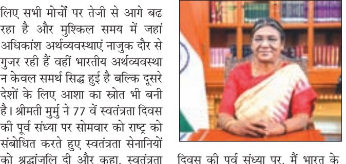
नगरिकों के साथ एकजुट हो कर सभी ज्ञात और अज्ञात स्वतंत्रता सेनानियों को कृतज्ञतापूर्वक श्रद्धांजलि अर्पित करती हूँ। उनके असंख्य बलिदानों से, भारत ने विश्व समुदाय में अपना स्वाभिमान-पूर्ण स्थान फिर से प्राप्त किया। स्वतंत्रता संग्राम में नारी शक्ति के योगदान का उल्लेख करते हुए उन्होंने कहा मार्तण्डी हाजरा और

▶▶ स्वतंत्रता सेनानियों को श्रद्धांजलि दी ▶▶ वैश्विक महामारी का असर पूरी दुनिया में ▶▶ किसानों के प्रति अपना आभार व्यक्त किया राष्ट्रीय खबर नयी दिल्ली: राष्ट्रपति द्रौपदी मुर्मु ने कहा है कि भारत विकसित राष्ट्र बनने के लिए सभी मोर्चों पर तेजी से आगे बढ़ रहा है और मुश्किल समय में जहां अधिकांश अर्थव्यवस्थाएं नाजुक दौर से गुजर रही हैं वहीं भारतीय अर्थव्यवस्था न केवल समर्थ सिद्ध हुई है बल्कि दूसरे देशों के लिए आशा का स्रोत भी बनी है। श्रीमती मुर्मु ने 77 वें स्वतंत्रता दिवस की पूर्व संध्या पर सोमवार को राष्ट्र को संबोधित करते हुए स्वतंत्रता सेनानियों को श्रद्धांजलि दी और कहा, स्वतंत्रता