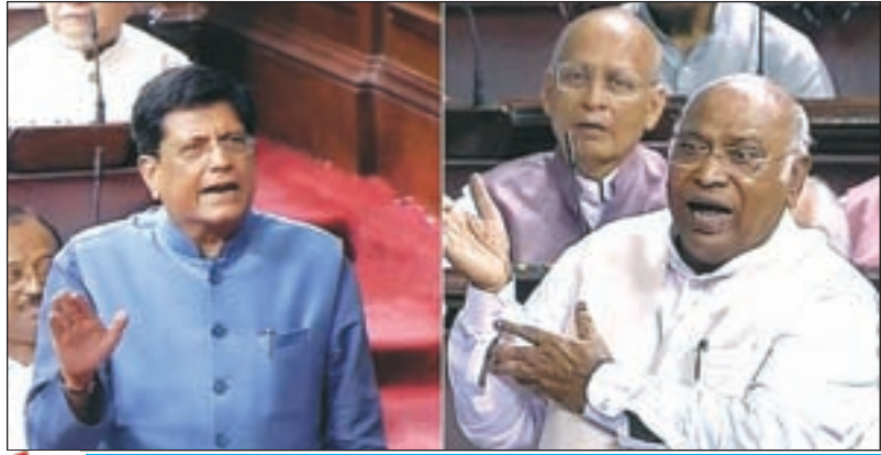
मोदी नहीं चाहते है मणिपुर में शांति बहाली : राहुल गाँधी

नई दिल्ली: संसद के मानसून सत्र शुक्रवार को पूरा होने के साथ ही लोकसभा की कार्यवाही अनिश्चित काल के लिए स्थगित कर दी गई। दो बार के स्थगन के बाद अपराह्न डेढ़ बजे सदन के समवेत होने पर अध्यक्ष ओम बिरला ने कहा कि 17वीं लोकसभा का 12वां सत्र 20 जुलाई से प्रारंभ होकर 11 जुलाई तक चला। मानसून सत्र के दौरान 17 बैठकों के दौरान 44.15 घंटे काम हुआ। मानसून सत्र में सदन की कार्य उत्पादकता 45 प्रतिशत रही। श्री बिरला ने कहा कि मानसून सत्र में कांग्रेस के गौरव गोगोई ने सरकार के विरुद्ध अविश्वास प्रस्ताव पेश किया। इस पर 19