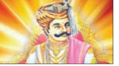
हिलाने लगे। उस चम्मच को हिलाते-हिलाते कुछ समय बीत गया, परन्तु राजा को कोई ईश्वर का दर्शन नहीं हुआ।

गतांक से आगे... मंत्र की तो मानों सारी चिंताएं समाप्त हो गयीं। उसने सन्यासी से पूछना चाहा कि आप राजा को ईश्वर के दर्शन किस प्रकार कराओगे, परन्तु सन्यासी ने कहा की वे स्वयं दरबार में चलकर राजा को उत्तर देंगे। फिर मंत्री सन्यासी को लेकर राजा के दरबार में पहुंचा और राजा से निवेदन किया कि महाराज यह महात्मा आपको ईश्वर के दर्शन करा देंगे। राजा ने प्रसन्ता से उस महात्मा का स्वागत किया। फिर महात्मा ने राजा से एक बड़ा सा पात्र मंगवाया जिसमें कच्चा दूध भरा हुआ था। महात्मा ने कहा की राजन अभी आपको ईश्वर के दर्शन करा देता हूँ। और ऐसा बोलकर उस पात्र के दूध को चम्मच से हिलाने लगे। उस चम्मच को हिलाते-हिलाते कुछ समय बीत गया, परन्तु राजा को कोई ईश्वर का दर्शन नहीं हुआ। तो राजा ने महात्मा से पूछा की आप क्या कर रहे हैं। महात्मा बोले दूध से मक्खन निकालने की कोसिस कर रहा हूँ। यह बात सुनकर राजा अचरज में पड़ गए, और महात्मा से बोला की मक्खन ऐसे थोड़ी निकलता है, पहले दूध को गर्म करना पड़ता है, फिर दही जमानी पड़ती है और फिर उसे बिलोकर