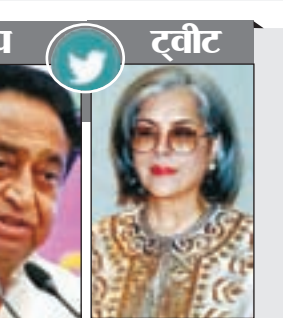
कमलनाथ कांग्रेस नेता

जिसके बाद प्रभावी कीमत 540 रुपये हो जाएगी। हालांकि, एक्सचेंज ऑफर का अधिकतम लाभ एक्सचेंज में दिए जाने वाले फोन की मौजूदा कंडीशन और मॉडल पर निर्भर करता है। Samsung Galaxy F14 5G के फीचर्स और स्पेसिफिकेशंस Samsung Galaxy F14 5G में 6.6 इंच की आईपीएस एलसीडी डिस्प्ले दी गई है, जिसका रेजोल्यूशन फुल एचडी+ और रिफ्रेश रेट 90Hz है। इस स्मार्टफोन में Samsung Exynos 1330 SoC दिया गया है। बैटरी बैकअप की बात की जाए तो इस फोन में 6,000mA की बैटरी दी गई है जो कि 25W चार्जिंग को सपोर्ट करती है। कैमरा सेटअप की बात करें तो Samsung Galaxy F14 5G के रियर में 50 मेगापिक्सल का प्राइमरी कैमरा और 2 मेगापिक्सल का माइक्रो कैमरा दिया गया है। वहीं इसमें सेल्फी और वीडियो कॉल के लिए 13 मेगापिक्सल का फ्रंट कैमरा दिया गया है।