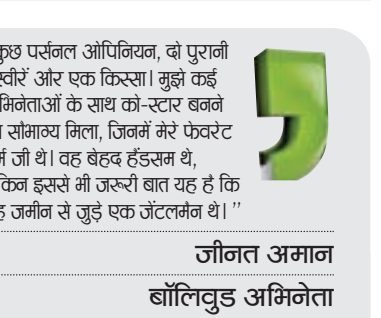
जौनत अमान बॉलिवुड अभिनेता