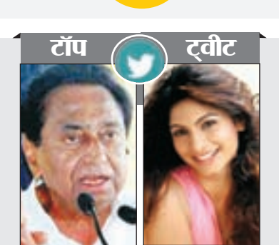
कमलनाथ कांग्रेस नेता