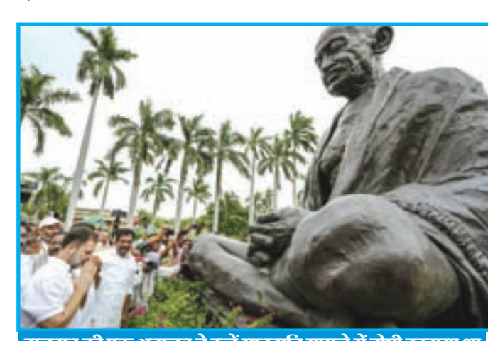
गुजरात की एक अदालत ने उन्हें मानहानि मामले में दोषी ठहराया था

श्री गांधी ने कहा था कि ट्रायल जज ने मामले में अधिकतम दो साल की सजा सुनाई थी, और कहा था कि