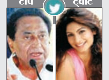
कमलनाथ कांग्रेस नेता