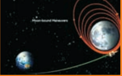
हालांकि, अत्यधिक अण्डाकार कक्षा में, यान आकाशीय पिंड (इस मामले में, चंद्रमा) का चक्कर लगाता है, जहाँ शरीर से इसकी दूरी काफी भिन्न होती है। यह भारतीय अंतरिक्ष कार्यक्रम के लिए एक महत्वपूर्ण मील का पत्थर है, कि सभी भारतीय चंद्र शिल्प चंद्रयान -1 (2008), चंद्रयान -2 (2019) और चल रहे चंद्रयान -3, चंद्रमा के

लगभग 3.84 लाख किलोमीटर की दूरी तय करने के बाद, भारत के तीसरे चंद्र अंतरिक्ष यान चंद्रयान-3 को चंद्र गुरुत्वाकर्षण ने कैद कर लिया है। वर्तमान में, यान अत्यधिक-अण्डाकार कक्षा में चंद्रमा की परिक्रमा कर रहा है। एक गोलाकार कक्षा में, एक अंतरिक्ष यान लगातार उस पिंड से एक निश्चित दूरी पर रहता है जिसकी वह परिक्रमा कर रहा है।