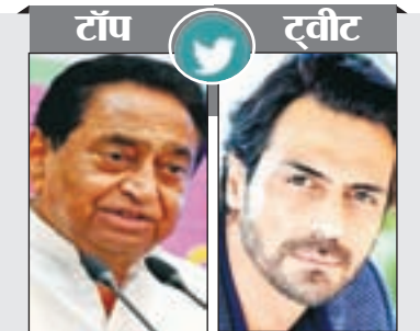
कमलनाथ कांग्रेस नेता

“माजपा ‘जातिगत सर्वेक्षण’ को कानूनी तर्कों में उलझाकर लंबे करवाणा चाहती थी, लेकिन पटना उच्च न्यायालय ने इस पर सभी रोक को हटाकर हर वोट, शोषित के लिए ‘सामाजिक न्याय’ ही नहीं बल्कि आने वाले समय में ‘आर्थिक न्याय’ का भी रास्ता खोल दिया है।”