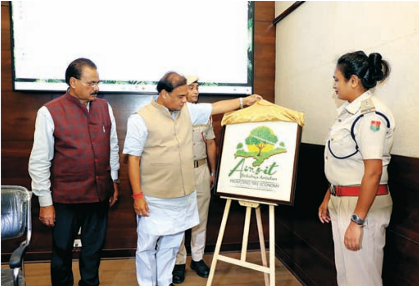
সাধারণ মানুষের অংশগ্রহণের উদ্দেশ্যে মোবাইল অ্যাপ, পর্টেল, থিমসং উদ্বোধন মুখ্যমন্ত্রী ড০ হিমন্ত বিশ্ব শর্মার