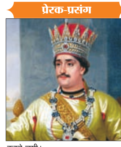
प्रेरक-प्रसंग करने लगी। आखिरकार विवश होकर राजा सेनापति व अन्य सभासदों को लेकर कोठरी के पास गया और दरवाजा खोला, जब कम्परे का दरवाजा खुला तो अंदर कुछ भी नहीं था सिवाय एक फटे हुए कपड़े के जो दीवाल की खुटी पे लटका था। मंत्री ने पूछा की महाराज यहा तो कुछ भी नहीं है। राजा ने उस फटे कपड़े को अपने हाथ में लेते हुए उदास स्वर में कहा कि यही तो है मेरा सबकुछ, जब भी मुझे थोड़ा सा भी अहंकार आता है, तो मे यहाँ आकर इन कपड़ों को देख लिया करता हूँ। मुझे याद आ जाता है की जब मै इस राज्य में आया था तो इस फटे कपड़े के अलावा मेरे पास कुछ भी नहीं था। तब मेरा मन शांत हो जाता है और मेरा धमण्ड समाप्त हो जाता है, तब मै वापस बाहर आ जाता हूँ। ...समाप्त।

अब गतांक से आगे ... यह बताइये कि उस कम्परे में एसी कौन सी वस्तु है, जिसकी सुरक्षा की आपकी इतनी फिक्र है। राजा गुस्से से बोले सेनापति, यह तुम्हारे पूछने का विषय नहीं है, यह प्रश्न दोबारा कभी मत करना। अब तो सेनापति का सक और भी बढ़ गया, धीरे-धीरे मंत्री और सभासदों ने भी राजा से पूछने का प्रयास किया परन्तु राजा ने किसी को भी उस कम्परे का रहस्य नहीं बताया। बात महारानी तक पहुंच गयी और आप तो जानते हैं ही स्त्री हट के आगे किसी की भी नहीं चलती, रानी ने खाना-पीना त्याग दिया और उस कोठरी की सच्चाई जानने की जिद