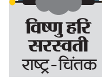
विष्णु हरि सरस्वती राष्ट्र-चिंतक