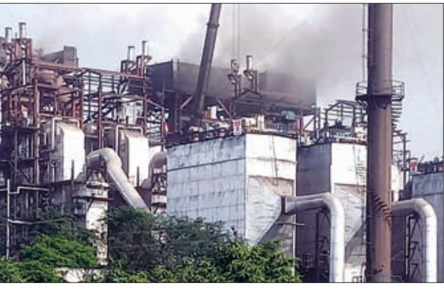
अंदर नया बॉयलर चालू करने की बात सामने आ रही है। जिसके कारण यह तेज ध्वनि सुनाई पड़ रही है। फैक्ट्री के

फैक्ट्री के अंदर नया बॉयलर चालू करने की बात सामने आ रही है फैक्ट्री में आपात स्थिति उत्पन्न हो गई है तेज ध्वनि सुनाई पड़ रही है