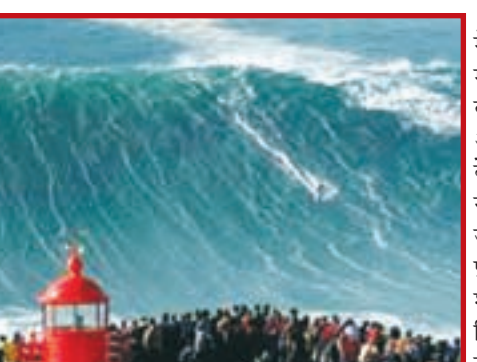
बड़ी तबाही समुद्र के रास्ते आयेगी। उत्सर्जन जारी रहता है, तो उष्णकटिबंधीय वैज्ञानिकों का अनुमान है कि सदी के मध्य

रांची: जलवायु परिवर्तन के साफ संकेत तो चारों तरफ दिख रहे हैं। इसके बीच ही वैज्ञानिकों ने इस बात की चेतावनी दी है कि धरती पर मौजूद जीवन के लिए सबसे