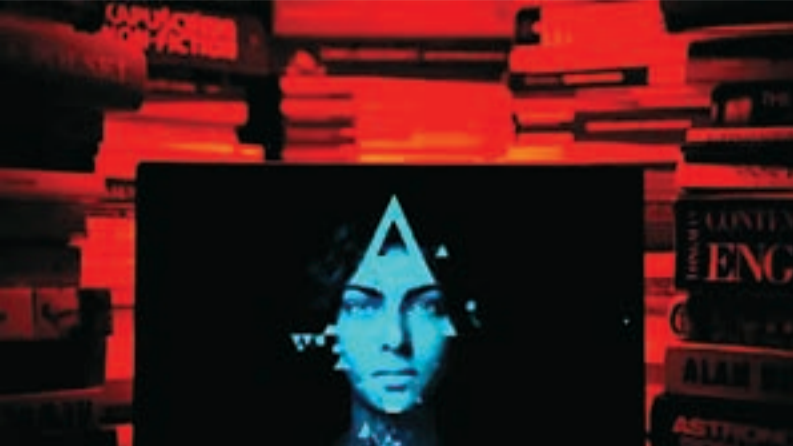
আইডেন্টিকায়ার ব্যবহার করে যা দিয়ে কম্পিউটারের তৈরি টেক্সট থেকে মানুষের লেখা টেক্সট আলাদা করা যায়।

ল্যা বিরিঙ্ছিয়াম মেজ - এই শব্দ দুটি পড়েই আমি কেন জানি না এক মুহূর্তের জন্য ধমকে গিয়েছিলাম। লেখাটি পড়তে পড়তে আমার মনের মধ্যে সতর্ক ঘণ্টা বাজতে শুরু করেছিল। আমি ১৮-১৬ বছর বয়সীদের জন্য বিজ্ঞানের বিষয়ে একটি রচনা প্রতিযোগিতায় বিচারকের দায়িত্ব পালন করছিলাম, কিন্তু এই বিশেষ রচনাটিতে ভাষা এতটাই পরিশীলিত ছিল যে তা একজন কিশোর লেখকের জন্য অসম্ভব বলে মনে হয়েছিল। এরপর এআই সনাতনকারী সফটওয়্যার ব্যবহার করে আমি রচনাটিকে পরীক্ষা করে দেখি। কয়েক সেকেন্ডের মধ্যে 'কপিলিকস' নামের ঐ সফটওয়্যারটি আমার কম্পিউটারের স্ক্রিনে যে ফলাফল তুলে ধরলো - তা ছিল গভীরভাবে হতাশাব্যঞ্জক : রচনাটির ৯৫.৯ ছিল এআই টুল ব্যবহার করে তৈরি। আরও নিশ্চিত হওয়ার জন্য আমি ভিন্ন একটি টুলের মাধ্যমে রচনাটি যাচাই করলাম ফলাফলে 'স্যাপলিং' আমাকে জানালো রচনার ৯৬.১ কোন মানুষের লেখা নয়। তৃতীয় আরেকটি টুল প্রথম ফলাফল দুটিই নিশ্চিত করলো, তবে এক্ষেত্রে স্কোর ছিল কিছুটা কম : ৮৯ এআই। তাই আমি 'উইনস্টন এআই' নামে আরেকটি সফটওয়্যারের মাধ্যমে রচনাটি যাচাই করলাম। কোন সন্দেহ নেই : রচনাটির মাত্র ১ মানুষের হাতে তৈরি। চারটি আলাদা এআই সনাক্তকারী সফটওয়্যারের বার্তাটি পরিস্কার : রচনাটির লেখক একজন এআই নকলবাজ। আমি বেশ কিছুদিন ধরেই জানতাম যে এআই ব্যবহার করে লেখা আমার নিজের পেশা সাংবাদিকতাসহ অনেক খাতের জন্য গুরুত্ব সহ চ্যালেঞ্জ তৈরি করছে। তবুও আমি এক্ষেত্রে অবাক হয়েছিলাম এই কারণে যে স্কুলের একজন ছাত্র ধরে নিয়েছিল রচনা প্রতিযোগিতার জন্য এআইয়ের তৈরি লেখা কমা দেয়াতে বিশেষ দোষের কিছু নেই।