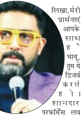
लिखा, मेरी प्रार्थनाएं आप के साथ हूँ, भायू, तुम ये डिजर्व करते हो। शानदार परफॉर्मेंस लव एंड मोर। इंडियन फिल्म फेस्टिवल ऑफ मेलाबर्न अक्टूबर 11 से 20 अगस्त के बीच में ऑस्ट्रेलिया के मेलाबर्न के आइस सेंटर के हैमर हॉल में होगा। इस प्रतिष्ठित फिल्म अवॉर्ड में 20 अलग-अलग भाषाओं में करीब 100 फिल्मों की स्क्रीनिंग भी की जाएगी।

मुंबई: बॉलीवुड अभिनेता अभिषेक बच्चन इंडियन फिल्म फेस्टिवल ऑफ मेलाबर्न में ब्रीद: इनटू द शैडोज के लिये बेस्ट मेन परफॉर्मेंस' के लिए नोमिनेट किये गये हैं। अभिषेक बच्चन को इंडियन फिल्म फेस्टिवल ऑफ मेलाबर्न में हब्वेस्ट मेन परफॉर्मेंस के लिए नोमिनेट किया गया है। अभिषेक को यह नोमिनेशन वेब सीरीज 'ब्रीद: इनटू द शैडोज' के लिए मिला है। इस नोमिनेशन के बाद अभिषेक बच्चन के पिता और महानायक अमिताभ बच्चन ने बेटे की इस उपलब्धि पर ट्वीट कर अपनी खुशी जाहिर की है। उन्होंने