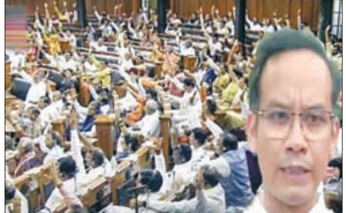
सरकार गिराना उनका मकसद नहीं है : विपक्ष

नईदिल्ली: यह सभी जानते हैं कि भाजपा की सरकार प्रचंड बहुमत में है। इसलिए निचले सदन में लाये गये अविश्वास प्रस्ताव का सरकार की सेहत पर कोई असर नहीं पड़ेगा। बावजूद इसके विपक्ष मानता है कि सदन के भागे चल रहे प्रधानमंत्री को कमसे कम इस प्रस्ताव के मुद्दे पर तो सदन के सामने आना ही पड़ेगा। भारत की संसद ने विपक्षी दलों के गठबंधन द्वारा प्रधान मंत्री नरेंद्र मोदी की सरकार के खिलाफ अविश्वास मत को अधिकृत किया है, ताकि हिंदू राष्ट्रवादी नेता को पूर्वोत्तर राज्य में जातीय संघर्ष के बारे में चिंताओं को विस्तार से संबोधित करने के लिए मजबूर किया जा सके। मोदी की भारतीय जनता पार्टी (भाजपा) के पास संसद के 542 सीटों वाले निचले सदन में 301 सदस्यों का स्पष्ट बहुमत है, इसलिए अविश्वास मत