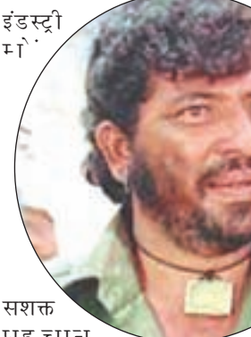
सशक्त पाह चान दिलायी लेकिन फिल्म के निर्माण के समय गब्बर सिंह की भूमिका के लिये पहले डैनी काना नम प्रस्तावित था। फिल्म 'शोले' के निर्माण के समय गब्बर सिंह वाली भूमिका डैनी को दी गयी थी लेकिन उन्होंने उस समय धर्मात्मा में

बदलाव आया और वह खलनायकी की दुनिया के बेटाज बादशाह बन गये। इसके बाद उन्होंने कभी पीछे मुड़कर नहीं देखा और अपने दमदार अभिनय से दर्शकों की वाहवाही लूटने लगे। वर्ष 1977 में प्रदर्शित फिल्म 'शतरंज के खिलाडी' में उन्हें महान निर्देशक सत्यजीत रे के साथ काम करने का मौका मिला। इस फिल्म के जरिये भी उन्होंने दर्शकों का मन मोह लिया। अपने अभिनय में आई एकरूपता को बदलने और स्वयं को चरित्र अभिनेता के रूप में भी स्थापित करने के लिये अमजद खान ने अपनी भूमिकाओं में परिवर्तन भी किया। इसी क्रम में वर्ष 1980 में प्रदर्शित फिरोज खान की सुपरहिट फिल्म 'कुबली' में अमजद खान ने हास्य अभिनय कर दर्शकों का भरपूर मनोरंजन किया। वर्ष 1981 में अमजद खान के अभिनय का नया रूप दर्शकों के सामने आया।