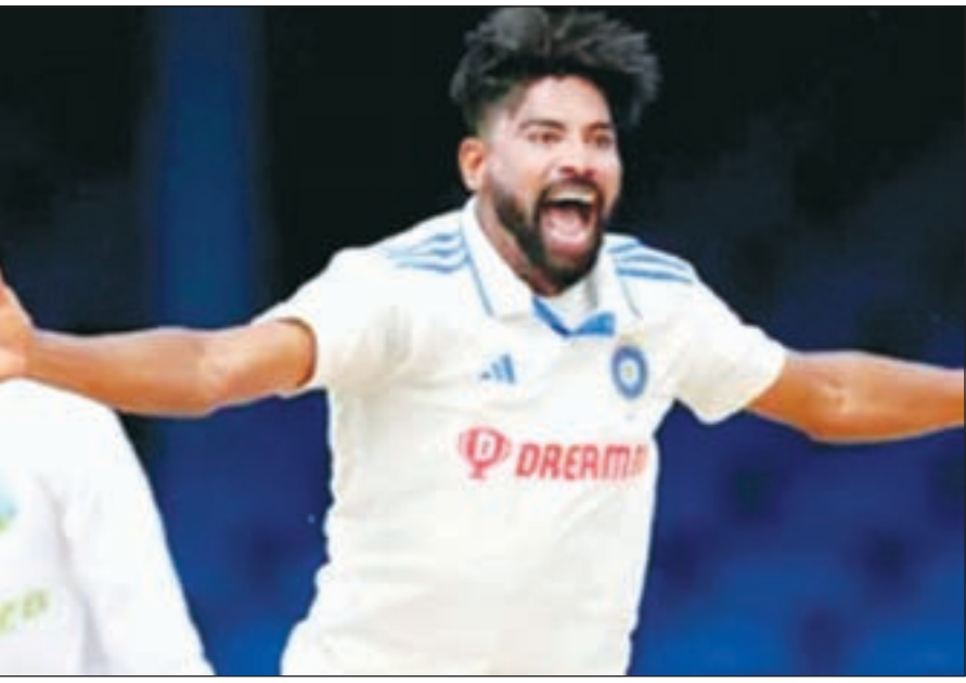
हासिल की। उन्हें इस प्रदर्शन के लिये मैन ऑफ द मैच का पुरस्कार भी दिया गया। इस बीच, सप्ताह टेस्ट रैंकिंग के शीर्ष 100 में पहुंचने वाले युवा प्रतिभावा न बल्लेबाज यशस्वी जायसवाल ने

दुबई: वीते कुछ महीनों में भारत के अग्रणी तेज गेंदबाज बनकर उभरे मोहम्मद सिराज ने बुधवार को अपने टेस्ट करियर की सर्वश्रेष्ठ रेटिंग हासिल कर ली। अंतरराष्ट्रीय क्रिकेट परिषद (आईसीसी) की ओर से जारी नवीनतम रैंकिंग के अनुसार, सिराज 563 रेटिंग पॉइंट के साथ टेस्ट गेंदबाजों की सूची में 33वें स्थान पर हैं। सिराज ने वेस्ट इंडीज के खिलाफ दूसरे टेस्ट की पहली पारी में पांच विकेट चटकाकर यह रेटिंग