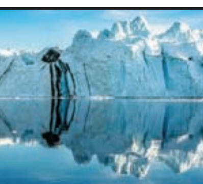
इतना बर्फ जमा है कि उसके पिघलने पर समुद्र का जलस्तर इतना अधिक बढ़

रांची: ग्रीनलैंड को आज के दौर में धरती के अन्यतम ठंडे इलाकों में से एक माना जाता है। जलवायु परिवर्तन के दौरान वहां से बर्फ की चारोंरों के पिघलने पर लगातार चिंता व्यक्त की जा रही है। दरअसल वहां