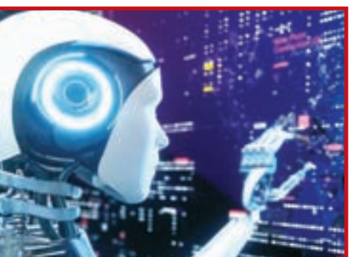
कार्यों में रोबोटो का प्रयोग है। कई अवसरों पर यह पाया गया है कि पूर्व से कोई निर्देश

इंसानी खतरा कम करने की कवायद है रोबोट भी इंसानों की तरह भूल जाते हैं याददाश्त के निरंतर विकास की प्रक्रिया राष्ट्रीय खबर रांची: रोबोटिक्स को दुनिया में आर्टिफिशियल इंटेलिजेंस यानी कृत्रिम बुद्धिमत्ता का इंटरसकारात्मक प्रयोग करने पर अनुसंधान जारी है। इसका असली मकसद इंसानी ज्ञान बचाते हुए खतरनाक