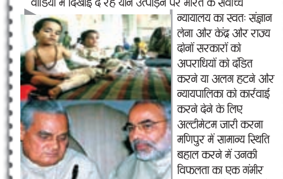
वीडियो में दिखाई दे रहे योग उत्पीड़न पर भारत के सर्वोच्च न्यायालय का वक्तः संज्ञान लेना और केंद्र और राज्य दोनों सरकारों को अपराधियों को दंडित करने या अलग हटाने और व्यापकालिका को कार्रवाई करने में देने के लिए अल्टीमेटम जारी करना मणिपुर में सामान्य स्थिति बहाल करने में उनकी विफलता का एक गंभीर आरोप है। संसद सदस्यों

गुजरात के दंगे पर जब हालात काबू में नहीं आ रहे थे तो तत्कालीन प्रधानमंत्री अटल बिहारी वाजपेयी ने वहां के न सिर्फ दंगे किया था बल्कि सार्वजनिक तौर पर वहां के मुख्यमंत्री नरेंद्र मोदी को राजधर्म का पालन करने की हिदायत दे दी थी। कहा तो यह भी जाता है कि दरअसल वहां से लाते ही अटल बिहारी वाजपेयी मुख्यमंत्री नरेंद्र मोदी को हटाना चाहते थे लेकिन उन्हें किसी तरीके से लालकृष्ण आडवाणी ने ऐसा नहीं करने के लिए मनाया था। अब मणिपुर में दंगे महीने के व्यापक और निरंतर हिंसा के बाद, जिसमें कई की शुरूआत में एक आगजनी भी शामिल थी, प्रधानमंत्री नरेंद्र मोदी ने अखिरकार अपनी चुप्पी तोड़ी तो राजधर्म का निर्वाहन नहीं किया। जब 4 मई को थोबल जिले में आदिवासी महिलाओं को नग्न घुमाने की वीडियो छवियों ने एक बार फिर राज्य में संघर्ष की जागृत प्रकृति को दिखाया। लेकिन श्री मोदी ने अभी तक संघर्ष के कारणों और परिणामों को स्वीकार नहीं किया है जिसके विरुद्ध से बाहर होना का खतरा है।