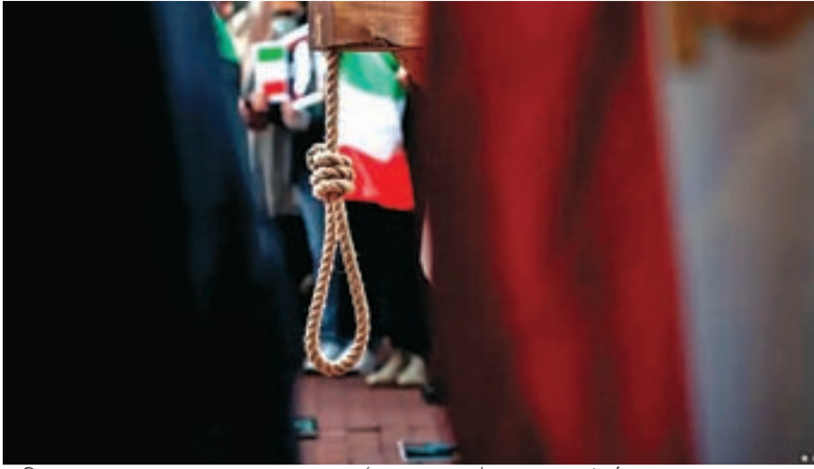
অভিযোগে কমপক্ষে সাতজনের মৃত্যুদণ্ড কার্যকর করা হয়। ধর্মগুরুদের দাবি, এভাবেই নাকি ইরানের শত্রুদের উসকানি দেয়া হয়েছে। ইরানে গিয়ে সর্বোচ্চ নেতা আয়াতুল্লাহ আলি