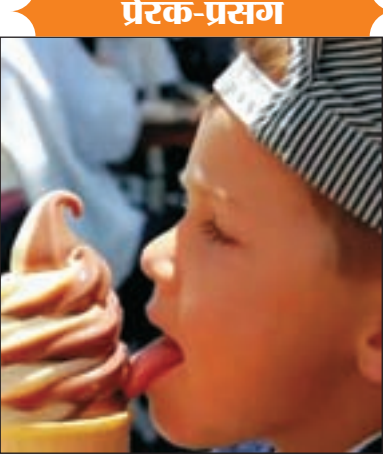
आइसक्रीम (orange flavor ice-cream) ले आईये। कुछ ही देर में वेंटर आइसक्रीम की प्लेट और

एक बार एक छोटा सा लड़का एक होटल में गया। कुछ ही देर में वहां वेंटर आया और उसने पुछा आपको क्या चाहिए सर? छोटे बच्चे ने उल्टा पुछा! वैनीला आइसक्रीम (vanilla ice-cream) कितने रूपए का है? उस वेंटर वाले ने जवाब दिया 50 रुपये का। यह सुन कर उस छोटे लड़के ने अपने जेब में हाथ डाल कर कुछ निकला और हिसाब किया। उसने दुबारा पुछा कि संतरा फ्लेवर आइसक्रीम (orange flavor ice-cream) कितने का है। वेंटर ने दुबारा जवाब दिया और कहा 35 रुपये का सर। यह सुने के बाद उस लड़के ने कहा! मेरे लिए एक संतरा फ्लेवर