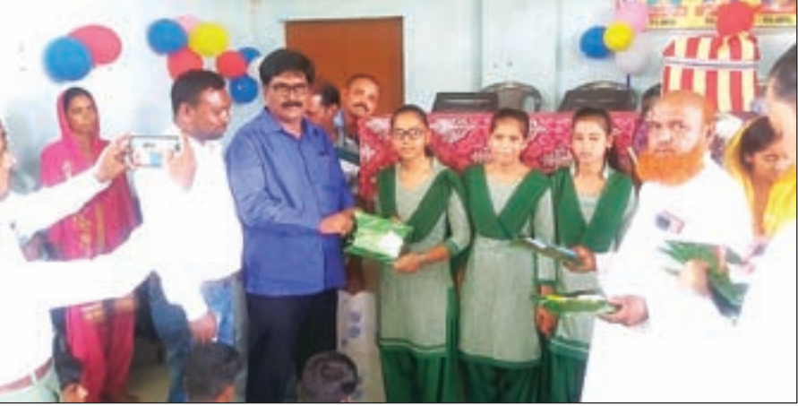
गुणवत्तायुक्त शिक्षा का अलख जगा रहा है। विद्यार्थी हमारे देश के भविष्य हैं और इनमें प्रतिभा की कोई कमी नहीं है। सिर्फ जरूरत होती है इन्हें मोटिवेट करने की।