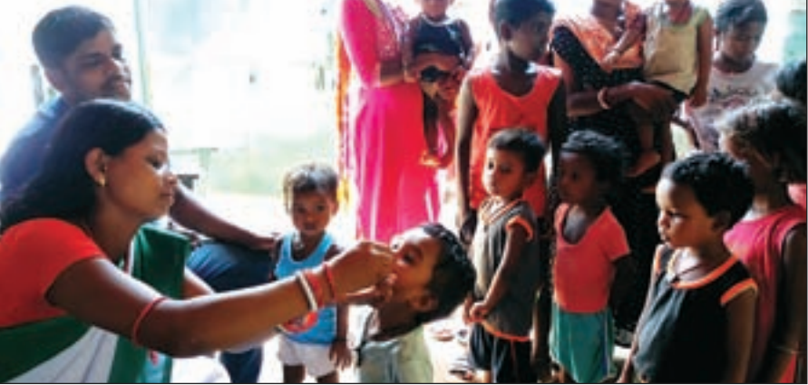
जिले में लगभग 3 लाख 53 हजार 255 बच्चों को पोलियो की खुराक पिलाने का लक्ष्य रखा गया है। मौके पर अनुमंडल पदाधिकारी

बोकारो: जिले में रविवार को उपायुक्त कुलदीप चौधरी एवं उप विकास आयुक्त कीर्ति श्री जी ने तीन दिवसीय पल्स पोलियो अभियान की शुरुआत की। इस दौरान उन्होंने चास स्थित उप स्वास्थ्य केंद्र चास में 05 साल से कम आयु के बच्चों को पोलियो की दो बूंद दवा पिलाकर कार्यक्रम का उद्घाटन किया। इसके तहत