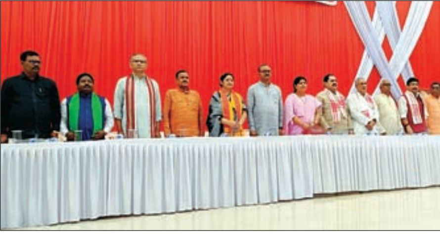
भाजपा का महाजनसंपर्क अभियान के लिए बैठक