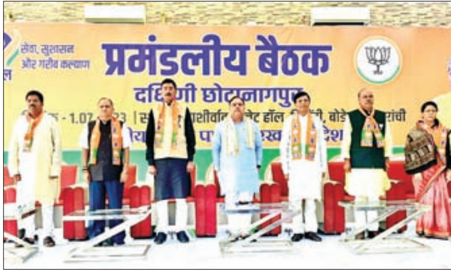
भाजपा का पमंडलीय बैठक में भाग लेते झारखंड के सांसद व विधायक।