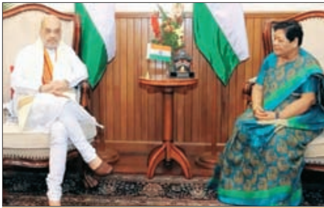
मणिपुर में हिंसा रोकने के लिए सीमा पर रेड अलर्ट

गुवाहाटी : केन्द्रीय गृह मंत्री अमित शाह ने मणिपुर के मुख्यमंत्री एन बीरेन सिंह से मुलाकात के दो दिन बाद 27 जून रात को मणिपुर की राज्यापाल अनुसुइया उइके से तत्काल मुलाकात की। मणिपुर की राज्यापाल सुश्री अनुसुइया उइके ने केन्द्रीय गृह मंत्री और सहकारिता मंत्री अमित शाह से मुलाकात की। सिंह ने 25 जून को मणिपुर की मौजूदा स्थिति पर चर्चा करने के लिए दिल्ली में केन्द्रीय गृह मंत्री शाह से मुलाकात की थी। मुख्यमंत्री ने गृह मंत्री को जमीनी हकीकत से अवगत कराया और पिछले एक सप्ताह में हिंसा को प्रभावी ढंग से रोकने में राज्य और केंद्र सरकारों के सहयोगात्मक प्रयासों पर प्रकाश डाला। मणिपुर के मुख्यमंत्री ने यह भी कहा कि केन्द्रीय गृह मंत्री ने आश्वासन दिया कि केंद्र सरकार मणिपुर में शांति बनाए रखने के लिए हर संभव कदम उठाएगी। हालांकि, गृह मंत्री अमित शाह ने मणिपुर हिंसा को लेकर खुफिया