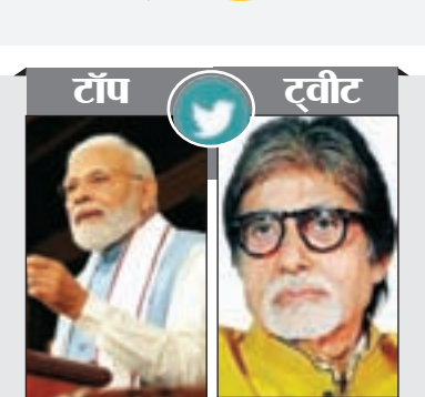
डॉ. टी. वी. नरसिम्हा राव

Tecno Camon 20 Pro 5G पर डिस्काउंट Tecno Camon 20 Pro 5G के 128GB स्टोरेज वेरिएंट की कीमत 19,999 रुपये है, जबकि 256GB स्टोरेज वेरिएंट की कीमत 21,999 रुपये है। लिमिटेड पीरियड ऑफर के तहत इच्छुक ग्राहक विभिन्न बैंक कार्ड्स से भुगतान करके 2,000 रुपये का फ्लैट डिस्काउंट पा सकते हैं। इस ऑफर की बढौतल 8GB + 128GB स्टोरेज वेरिएंट 17,999 रुपये में मिल जाएगा और 8GB + 256GB स्टोरेज वेरिएंट 19,999 रुपये में मिल जाएगा।