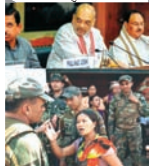
कानूनों में सुधार की पहल का ध्यान विभिन्न धर्मों को नियंत्रित करने वाले कानूनों में एकसुरता लाने के प्रयास के बजाय सभी प्रकार के भेदभाव को खत्म करना होना चाहिए। दस्तावेज प्रकृति में प्रगतिशील था, क्योंकि इसमें एकसुरता पर गैर-भेदभाव पर जोर दिया गया था, और यह माना गया था कि समाज पर नियमों का एक सेंट लावू करने के बजाय विवाह, तलाक, विरासत और गोद लेने जैसे व्यक्तिगत कानून के पहलुओं को नियंत्रित करने के विविध साधन हो सकते हैं। इसमें भेदभावपूर्ण प्रावधानों को हटाना होना, विशेष रूप से वे जो महिलाओं को प्रभावित करते हैं, और समानता में निहित कुछ व्यापक मानदंडों को अपनाना होना। तब से ऐसा कुछ भी महत्वपूर्ण नहीं हुआ है जिसके लिए नए सिरे से विचार करने की आवश्यकता हो, सिवाय इसके कि शायद तत्काल व्यवस्था के लिए इस मुद्दे को चुनावी क्षेत्र में लाना एक राजनीतिक आवश्यकता है। अब मणिपुर की बात करें तो जब समूह एक-दूसरे के खिलाफ अनिश्चित और लक्षित हिंसा में संलग्न होते हैं, आपूर्ति के परिचयन को रोकने के लिए नाकाबंदी का उपयोग करते हैं, और विस्थापित लोगों को उनके घरों में वापस जाने से रोकते रहते हैं तो कोई निवारण नहीं हो सकता है। किसी अन्य संघर्ष को उभरने से रोकने के लिए शिकायतें सुनने से पहले सामान्य स्थिति में लौटना पहला कदम है। अर्थसैनिक बलों की मौजूदगी और केंद्रीय गृह मंत्री अनिल शाह द्वारा आदिवासी और इंग्लिश घाटी क्षेत्रों के दूरे के बाढ़ शान्ति की अपील पर्याप्त नहीं है। सर्वदलीय बैठक में भी इस मौषण समस्या के समाधान पर कोई रास्ता केंद्र सरकार के पास नहीं दिखा। सिर्फ सेना के सहरा स्थिति को नियंत्रित रखने का अर्थ है कि वहां के पूरे समाज को स्थायी तौर पर बांट देना ही है। शांति की स्थितियां स्थापित करने के संदर्भ में, जिसमें लूटे गए हथियारों को वापसी और विस्थापित लोगों की उनके क्षतिग्रस्त घरों में धीमी और निश्चित वापसी शामिल होगी, बहुत कम प्रगति हुई है। राज्य में प्रतिष्ठित सार्वजनिक हस्तियों को शामिल करने वाली केंद्र सरकार की शांति समिति के गठन में बाधा आ गई है, क्योंकि उनमें से कई ने इसमें शामिल होने से इनकार कर दिया है या सुझाव दिया है कि उन्हें पूर्व परामर्श के बिना समिति में जोड़ा गया है। शांति पहल की सफलता के लिए आवश्यक है कि संघर्ष में सभी समूहों का प्रतिनिधित्व किया जाए और इसमें सार्वजनिक प्रतिष्ठित वाले या उनकी पहचान से परे रिपोर्ट वाले प्रतिनिधि शामिल हों। इस पहल से कुछ सार्वजनिक हस्तियों के हटने से दुर्भाग्य से मणिपुर में नागरिक समाज के जातीयकरण का पता चलता है और शांति निर्माण जटिल हो जाता है। अधिक चिंता की बात यह है कि कुक्की-जो प्रतिनिधियों ने स्पष्ट रूप से अपना नाम वापस ले लिया है क्योंकि समिति में मणिपुर के मुख्यमंत्री एन. बॉरेन सिंह भी शामिल थे, जबकि मंत्रालय नागरिक समाज के प्रतिनिधियों को एक-दूसरे से बाध करने के लिए राजी करना नहीं छोड़ना चाहिए। तथ्य यह है कि इस मुद्दे पर किसी भी अगले कदम को आगे बढ़ाने के लिए केंद्र सरकार के तत्वावधान की आवश्यकता है, यह सभी दलों के विश्वास को बनाए रखने में बीरेन सिंह प्रशासन की विफलता को भी दर्शाता है। ऐसा लगता है कि केंद्र सरकार और सत्तासद भारतीय जनता पार्टी के लिए एक वकल्पिक नेतृत्व के बारे में सोचने का समय आ गया है जो शांति निर्माण की प्रक्रिया को आसान बना सकता है क्योंकि श्री सिंह के कार्यों ने, हिंसा से पहले और उसके बाद दोनों में, या तो उपमार्गी रहे या प्रभावी ढंग से शासन करने में असमर्थता दिखाई।