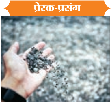
प्रैक-प्रसंग किया, ह्व में चाहता हूँ कि आप इस बात को समझें कि ये जार आपकी life को represent करता है। बड़े-बड़े पत्थर आपके जीवन की जरूरी चीजें हैं - आपकी family, आपका partner, आपकी health, आपके बच्चे ऐसी चीजें कि अगर आपकी बाकी सारी चीजें खो भी जाएं और सिर्फ ये रहे तो भी आपकी जिन्दगी पूर्ण रहेगी।

Philosophy के एक professor ने कुछ चीजों के साथ class में प्रवेश किया। जब class शुरू हुई तो उन्होंने एक बड़ा सा खाली शीशे का जार लिया और उसमें पत्थर के बड़े-बड़े टुकड़े भरने लगे। फिर उन्होंने students से पूछा कि क्या जार भर गया है? और सभी ने कहा हाँ। प्रोफेसर ने छोटे-छोटे कंकड़ों से भरा एक बॉक्स लिया और उन्हें जार में भरने लगे। जार को थोड़ा हिलाने पर ये कंकड़ पत्थरों के बीच settle हो गए। एक बार फिर उन्होंने छात्रों से पूछा कि क्या जार भर गया है? और सभी ने हाँ में उत्तर दिया। तभी professor ने एक sand box निकाला और उसमें भरती रेत को जार में डालने लगे। रेत ने बची-खुची जगह भी भर दी। और एक बार फिर उन्होंने पूछा कि क्या जार भर गया है? और सभी ने एक साथ उत्तर दिया, 'फिर professor ने समझाना शुरू