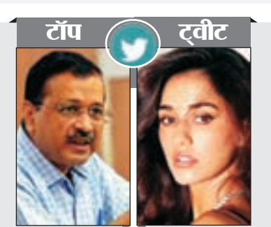
द्वेषा पाटनी बॉलिवुड अभिनेत्री

“उपराज्यपाल को इस्तीफा दे देना चाहिए। किसी ऐसे व्यक्ति के लिए रास्ता बनाएं, जो दिल्ली के लोगों को सुरक्षा प्रदान कर सकें। अगर केंद्र सरकार दिल्ली को सुरक्षित नहीं बना सकती तो इसे हमें सौंप दें। हम आपको दिखाएंगे कि किसी शहर को उसके नागरिकों के लिए केश सुरक्षित बनाया जाए।” अरविंद केजरीवाल दिल्ली के मुख्यमंत्री