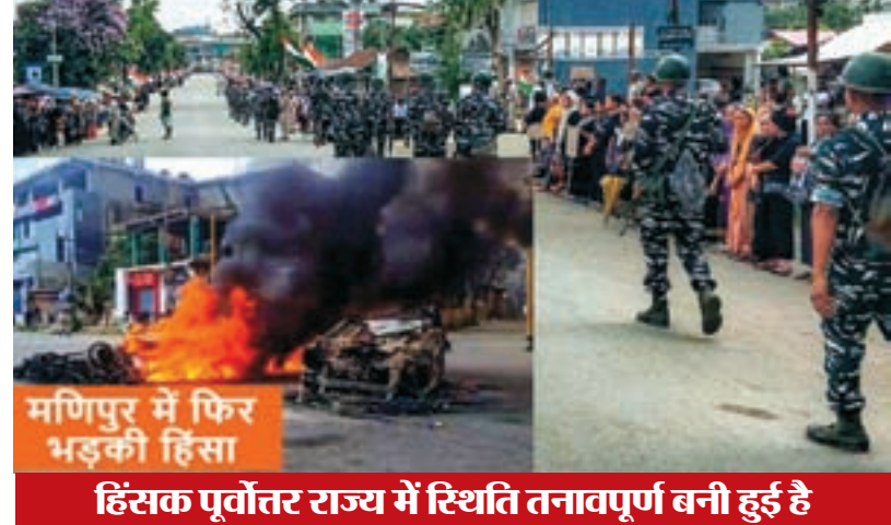
मणिपुर में फिर बड़की हिंसा हिंसक पूर्वोत्तर राज्य में स्थिति तनावपूर्ण बनी हुई है

केन्द्र सरकार, राज्य सरकार और तमाम सुरक्षा एजेंसियों की कार्रवाई के बावजूद मणिपुर में हिंसा कम होने का नाम नहीं ले रही है। दिन-ब-दिन नए इलाकों में हिंसा हो रही है। केन्द्र सरकार इस बारे में बहुत चिंतित है। सरकारी सूत्रों के अनुसार मणिपुर में 14 जून को कांगपोकपी जिले के ख़मेनलोक गांव में उपद्रवियों द्वारा की गई गोलीबारी और आगजनी की घटनाओं में 10 लोगों की मौत हो गई और 12 अन्य गंभीर रूप से हो गए। खबरों के अनुसार, उपद्रवियों ने ख़मेनलोक गांव में कई घरों को जला दिया, और ताम्बोलोंग जिले के गोबाजुंग में कई लोग घायल हो गए। पूर्वी इंफाल जिले के जिला मजिस्ट्रेट द्वारा जारी एक आदेश में उल्लेख किया गया है, 13 जून, 2023 के इस कार्यालय आदेश के तहत 14 जून, >> पेज 2 भी देखें