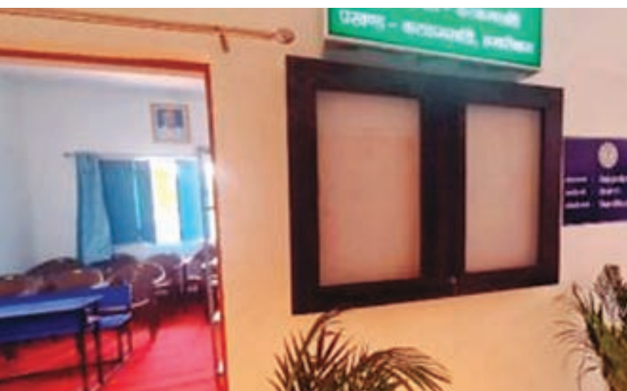
ऑनलाइन शिक्षा केंद्र, सूचना केंद्र

रांची: हमारा पुस्तकालय हमारी नई उड़ान पंचायती राज विभाग की अनूठी पहल के तहत पढ़ने और ज्ञान को बढ़ावा देने के उद्देश्य से पंचायत ज्ञान केंद्र को राज्य के सारे जिले में स्थापित करने का काम तेजी से शुरू हो गया है। अधिकारियों ने बताया कि इसे चरणबद्ध तरीके से प्रारंभ किया गया है, हजारीबाग के कटकमसांडी में इसकी स्थापना भी कर दी गयी है। योजना के तहत राज्य में फिलहाल 500 पंचायत ज्ञान केंद्र की स्थापना की जाएगी। इसके तहत ग्राम पंचायत में एक ऐसे केंद्र की परिकल्पना की गयी है जहां पुस्तकालय के साथ-साथ