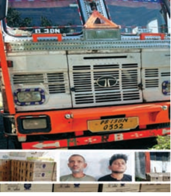
द्वारा जीटी रोड पर उक्त गाड़ी का आने का इंतजार कर रहा था। इसी क्रम में महदुई मोड़ के पास उक्त ट्रक आते दिखाई दिया, जिसे पुलिस बल द्वारा चेकिंग हेतु रुकने का इशारा किया गया परन्तु पुलिस

पुलिस बल को देखकर उक्त गाड़ी के चालक तेजी से गाड़ी को भगाने लगा