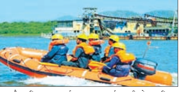
18 और अधिकतम 50 वर्ष तक होनी चाहिये। इच्छुक आवेदकों को खेलगांव, रांची के अलावे कांके डैम, रांची और पतरातू डैम, रामगढ़ में इसकी ट्रेनिंग दी जायेगी। लाइफ सेविंग टेक्निक का पूरा प्रोग्राम कुल 1 माह का होगा। इसमें नये प्रशिक्षुओं के साथ साथ लाइसेंस रिवेलिडेशन या रिन्युवल का कार्यक्रम भी होगा। प्रशिक्षण की शुरुआत 16 जून से होगी। 16 जून से 26 जून तक चलने वाले प्रोग्राम में 30 नये प्रशिक्षुओं को मौका मिलेगा जबकि 20 ऐसे कैडिडेट को मौका मिलेगा जिन्हें पास पूर्व से लाइसेंस हो। (पावरबोट हैडलिंग का, रिन्युवल के लिए)। इसी तरह से 28 जून से

राष्ट्रीय खबर रांची: राज्य सरकार राज्य में वाटर स्पोर्ट्स और इसके लिए लाइफ सेविंग टेक्निक को प्रमोट करने में लगी है। इस क्रम में पर्यटन, कला संस्कृति एवं युवा कार्य विभाग, झारखंड ने दस दिवसीय लाइफ सेविंग टेक्निक- वाटरस्पोर्ट्स और पावर बोट हैडलिंग टिलर ट्रेनिंग कार्यक्रम आयोजित करने की योजना बनायी है। राष्ट्रीय जल क्रीड़ा संस्थान, गोवा के सहयोग से झारखंड के जलाशयों, जलप्रपातों के नजदीक रहने वाले स्थानीय नाविकों और पर्यटन मित्रों को इसे सीखने में प्राथमिकता दी जानी है। नाविकों और पर्यटन मित्रों की आयु 31 मार्च 2023 को न्यूनतम