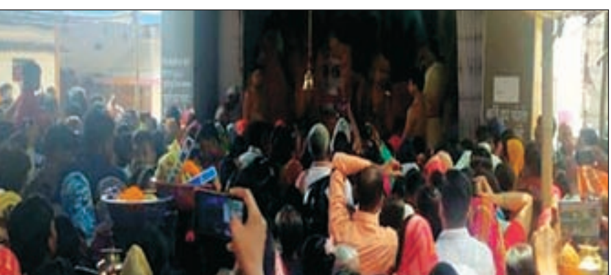
राष्ट्रीय खबर रांची: इस वर्ष 20 जून को रथ यात्रा है। इससे पहले ज्येष्ठ पूर्णिमा की तिथि महत्वपूर्ण मानी जाती है क्योंकि इसी दिन भगवान जगन्नाथ 108 घड़ों के पानी से स्नान के बाद बीमार पड़ जाते हैं। रांची के जगन्नाथपुर मंदिर में भगवान जगन्नाथ के साथ उनके भाई बलभद्र और बहन सुभद्रा कि सहस्त्रधारा स्नान विधि की गई। जगन्नाथपुर मंदिर परिसर में भक्तों की भारी भीड़ उमड़ती। ज्येष्ठ पूर्णिमा को भगवान जगन्नाथ को 108 घड़ों के ठंडे पानी से स्नान कराया जाता है, जिसके बाद भगवान को बुखार आ जाता है। 15 दिनों तक भगवान जगन्नाथ को एकांत में एक विशेष कक्ष में रखा जाता है। जहां केवल उनके वैद्य और निजी सेवक ही उनके दर्शन कर सकते हैं। भगवान जगन्नाथ के मंदिर के कपाट भी बंद रहेंगे। उसके बाद 15वें दिन मंदिर के कपाट खुलेंगे और भगवान जगन्नाथ अपने भक्तों को दर्शन देंगे। फिर जगन्नाथ रथ यात्रा का प्रारंभ होगा। रथ यात्रा के आरंभिक चरण में भगवान जगन्नाथ को स्नान कराया जाता है, उसके बाद रथ यात्रा निकाली जाती है। बत्ता दें कि हर साल एक बार भगवान जगन्नाथ को स्नान कराया जाता है, जिसे स्नान यात्रा भी कहते हैं। स्नान यात्रा करने के बाद 15 दिन के लिए भगवान जगन्नाथ ह्यबीमारूह पड़ जाते हैं। 15 दिनों के लिए मंदिर बंद कर दिया जाता है। यहां तक भगवान जगन्नाथ की रसोई भी बंद कर दी जाती है। भगवान को 56 भोग भी नहीं खिलाया जाता। 56 भोग की जगह भगवान को 15 दिनों तक काढ़ा का भोग लगाया जाता है।