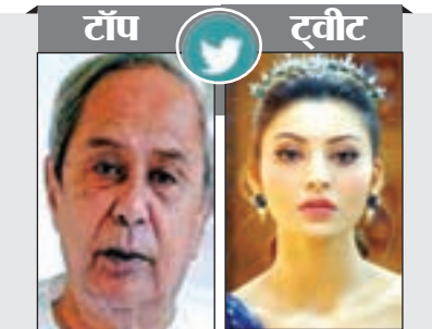
नवीन पटनायक ओडिशा के मुख्यमंत्री

“यात्रियों की सुविधाओं को ध्यान में रखते हुए रथियार से कोलकाता के लिए मुफ्त बस सेवा पुरी, मुबनश्चर और कटक से उपलब्ध होगी और इसका पूरा खर्च मुख्यमंत्री राहत कोष से वहन किया जाएगा।”