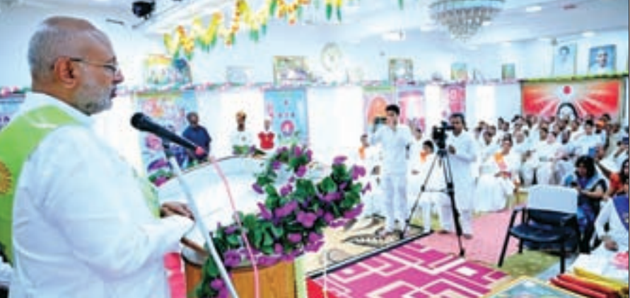
और नशामुक्त समाज का निर्माण कर सकते हैं। राज्यपाल आज प्रजापिता ब्रह्माकुमारी ईश्वरीय विश्वविद्यालय द्वारा हरमू रोड, रांची स्थित कार्यालय में आयोजित नशा मुक्ति अभियान के अवसर लोगों को संबोधित कर रहे थे। राज्यपाल ने कहा कि मादक द्रव्यों का सेवन एक गंभीर मुद्दा है जिसने हमारे समाज को बहुत लंबे समय तक त्रस्त कर रखा है। इससे अनगिनत लोगों की जान गई है, व्यक्तियों, परिवारों और समाज को अपूरणीय क्षति हुई है। उन्होंने नशा मुक्ति अभियान के आयोजन लिए प्रजापिता ब्रह्माकुमारी ईश्वरीय विश्वविद्यालय को बधाई देते हुए कहा कि नशीले पदार्थों के सेवन व इसके दुष्परिणामों के बारे में जागरूकता पैदा करने के उद्देश्य से इस कार्यक्रम का आयोजन सकारात्मक है। उन्होंने कहा कि उनके द्वारा भी 5 सूत्री कार्यक्रम के तहत, जिसमें नशीले पदार्थों का उन्मूलन शामिल था, 93 दिनों तक लगातार 19000 किलोमीटर की रथ यात्रा निकाली गई थी। राज्यपाल ने कहा कि विडंबना है कि कुछ लोग जानकारी के अभाव में नशीली दवाओं के दुरुपयोग में संलग्न हो जाते हैं। स्वार्थी लोगों द्वारा अपने गलत उद्देश्यों की पूर्ति के लिए मासूमों को नशीली दवा दी जाती है, ऐसे कई उदाहरण भी सामने आए हैं।

राष्ट्रीय खबर रांची: राज्यपाल सीपी राधाकृष्णन ने कहा कि नशाखोरी आधुनिक समाज की सबसे ज्वलंत समस्याओं में से एक है। कई मायनों में यह लाईलाज बीमारियों से भी अधिक खतरनाक है। नशीली दवाओं के सेवन से उनका जीवन तो बर्बाद होते ही हैं, उनके परिवार को भी बहुत पीड़ा का सामना करना पड़ता है। नशा मुक्ति अभियान की सफलता अकेले सिर्फ एक संगठन की जिम्मेदारी नहीं है, इसके लिए समाज के सभी सदस्यों को सामूहिक प्रयास व सहयोग करने की आवश्यकता है। हम सामूहिक रूप से प्रयास कर एक सकारात्मक बदलाव ला सकते हैं