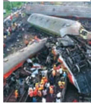
वृद्धि हुई है बुलेट ट्रेन के आदेश दिए जाने के बाद। अधिकारियों ने ट्रेन के कारण के निदान पर काम का निर्धारण करने के लिए उच्च-स्तरीय जांच का आदेश दिया है, हालांकि राज्य के एक वरिष्ठ रेलवे अधिकारी ने बताया कि उन्हें संदेह है कि यह ट्रैफिक सिग्नल की विफलता के कारण था।

भारत के इतिहास में सबसे खराब ट्रेन दुर्घटनाओं में से एक देश के विशाल और पुराने रेल नेटवर्क की सुरक्षा पर सवाल उठा रही है, क्योंकि सरकार इसके आधुनिकीकरण में विवेक कर रही है। बड़े ही ताम झाम के साथ बुलेट ट्रेन लाने का एलान किया गया है। इसके बीच जिस कचव का काफी जोर शोर से प्रचार किया गया था, उसे भी अभी सभी ट्रेनों में लागू नहीं किया जा सका है क्योंकि धन की कमी है। उड़ीसा के बालासोर के करीब हुए इस मीषण ट्रेन दुर्घटना में 280 से अधिक लोग मारे गए और 1,000 से अधिक घायल हो गए। अब इसके बाद क्या होगा, इससे भारतीय जनता अच्छे तरह वाकिफ है। जैसा कि अधिकारियों ने हताहतों की संख्या और जीवित बचे लोगों की तलाश जारी रखी है, जांचकर्ता इस बात की जांच करेंगे कि देश के पुराने रेलवे बुनियादी ढांचे में ग्रासदी में किन हद तक योगदान दिया। भारत का व्यापक रेल नेटवर्क, जो दुनिया के सबसे बड़े नेटवर्क में से एक है, ब्रिटिश औपनिवेशिक शासन के तहत 160 साल पहले बनाया गया था। आज, यह दुनिया के सबसे अधिक आबादी वाले देश में 67,000 मील के ट्रैक पर प्रतिदिन लगभग 11,000 ट्रेनें चलती हैं। अधिकारियों ने ट्रेन के कारण के निदान पर काम का निर्धारण करने के लिए उच्च-स्तरीय जांच का आदेश दिया है, हालांकि राज्य के एक वरिष्ठ रेलवे अधिकारी ने बताया कि उन्हें संदेह है कि यह ट्रैफिक सिग्नल की विफलता के कारण था।