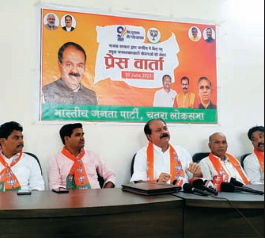
मुखिया और वहां के राष्ट्रपति, प्रधानमंत्री उनसे सीख लेने को उत्सुक रहते हैं। विगत नौ वर्ष के कार्यकाल में केंद्र की एनडीए सरकार न केवल विकास में बल्कि समाज के अंतिम पायदान