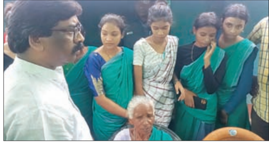
मुख्यमंत्री आम लोगों से बात करते हुए