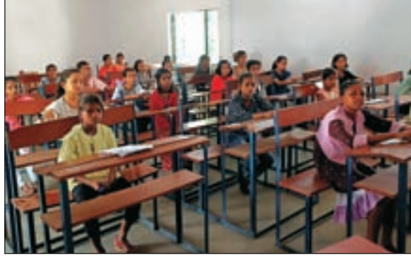
आवासीय विद्यालय साहिबगंज में नामांकन को ले प्रवेश परीक्षा आयोजित हुआ। प्लस टू कक्षा पोखरिया स्कूल साहिबगंज को लेकर शिक्षा विभाग को कुल 86 आवेदन प्राप्त हुए हैं। मॉडल स्कूल बरहेट के कक्षा 6 में 40

साहिबगंज: स्कूल ऑफ एक्सप्लेंस के तहत जिले में 2 मई से शुरू हुए 4 उत्कृष्ट विद्यालयों में नामांकन को लेकर मंगलवार से दो दिवसीय प्रवेश परीक्षा का शुभारंभ हुआ। पहले दिन बीडी हाई स्कूल सकरीगली, मॉडल स्कूल बरहेट और कस्तूरबा गांधी बालिका