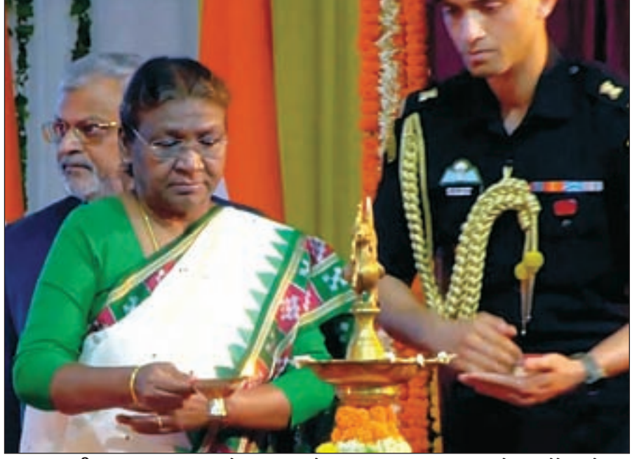
राष्ट्रीय ख़बर रांची: राष्ट्रपति द्रौपदी मुर्मू ने बुधवार को झारखंड हाइकोर्ट के

नये भवन का रिमोट का बटन दबा कर उद्घाटन किया। मौके पर राज्यपाल सीपी राधाकृष्णन,