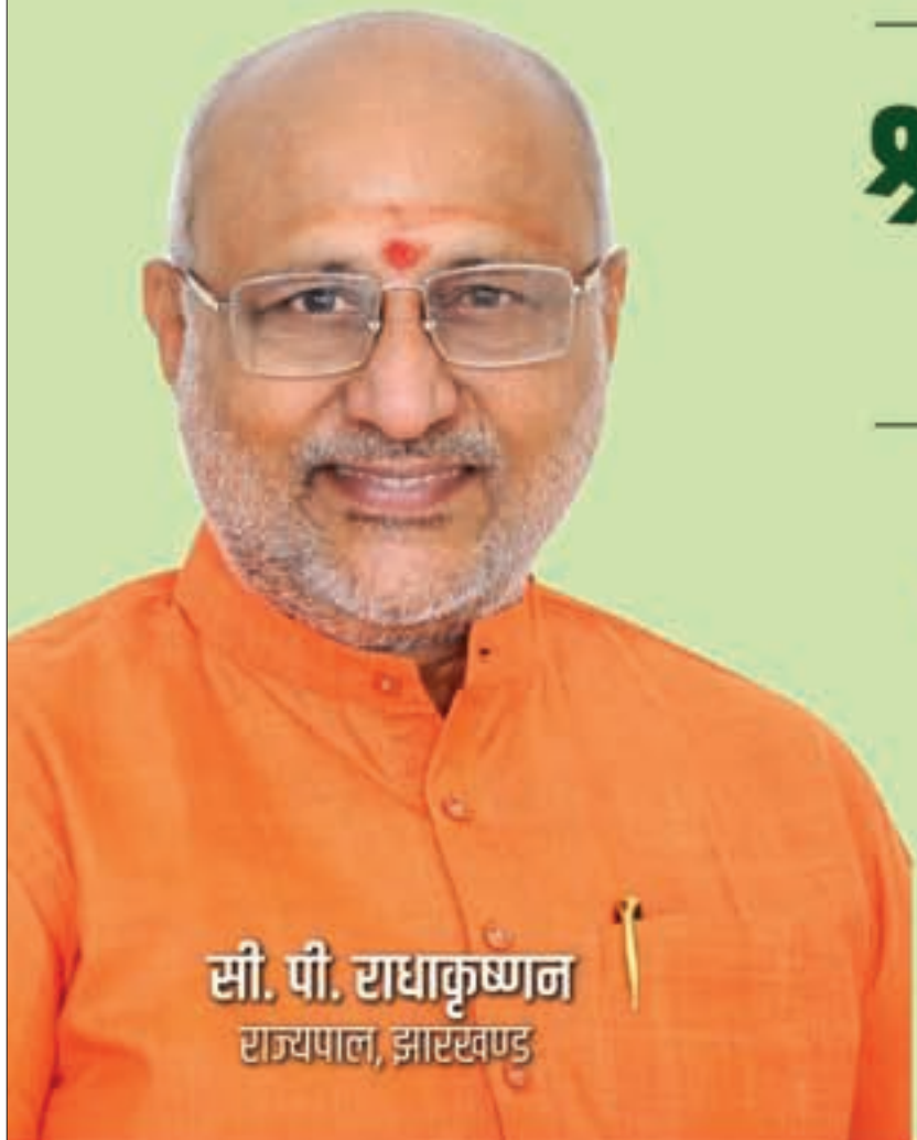
सी. पी. राधाकृष्णन राज्यपाल, झारखण्ड