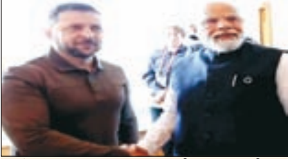
हिरोशिमा (जापान) : प्रधानमंत्री नरेंद्र मोदी ने

जी-7 शिखर सम्मेलन से इतर यूक्रेन के राष्ट्रपति वोलोदीमिर जेलेन्स्की से द्विपक्षीय मुलाकात की और रूस यूक्रेन के बीच संघर्ष को समाप्त करने के लिए बातचीत एवं कूटनीतिक प्रयासों को भारत का समर्थन एवं यूक्रेन के लोगों को मानवीय सहायता देने की बात दोहरायी। प्रधानमंत्री श्री मोदी ने यहां श्री जेलेन्स्की के मुलाकात के बाद टवीट किया, हिरोशिमा में राष्ट्रपति जेलेन्स्की से मुलाकात की। हमने आगे का रास्ता खोजने के लिए बातचीत और कूटनीति के लिए भारत के स्पष्ट समर्थन से अवगत कराया। हम यूक्रेन के लोगों को मानवीय सहायता देना जारी रखेंगे। श्री मोदी ने फ्रांस के राष्ट्रपति इमैनुएल मैक्रों के साथ भी द्विपक्षीय बैठक की। नेताओं ने क्षेत्रीय विकास और वैश्विक चुनौतियों पर विचारों का आदान-प्रदान किया। दोनों नेताओं ने व्यापार और आर्थिक क्षेत्रों में सहयोग, नागरिक उड्डयन, नवीकरणीय, संस्कृति, रक्षा क्षेत्र में सह-उत्पादन और विनिर्माण, साथ ही असेन्य परमाणु सहयोग के अलावा नए क्षेत्रों में भी साझेदारी का विस्तार करने पर सहमति जतायी। श्री मोदी ने उन्हें 14 जुलाई को बैस्टिल दिवस के लिए सम्मानित अतिथि के रूप में आमंत्रित करने के लिए राष्ट्रपति श्री मैक्रों को धन्यवाद दिया। प्रधानमंत्री ने भारत की जी-20 अध्यक्षता के लिए फ्रांस के समर्थन के लिए भी राष्ट्रपति श्री मैक्रों का आभार जताया।