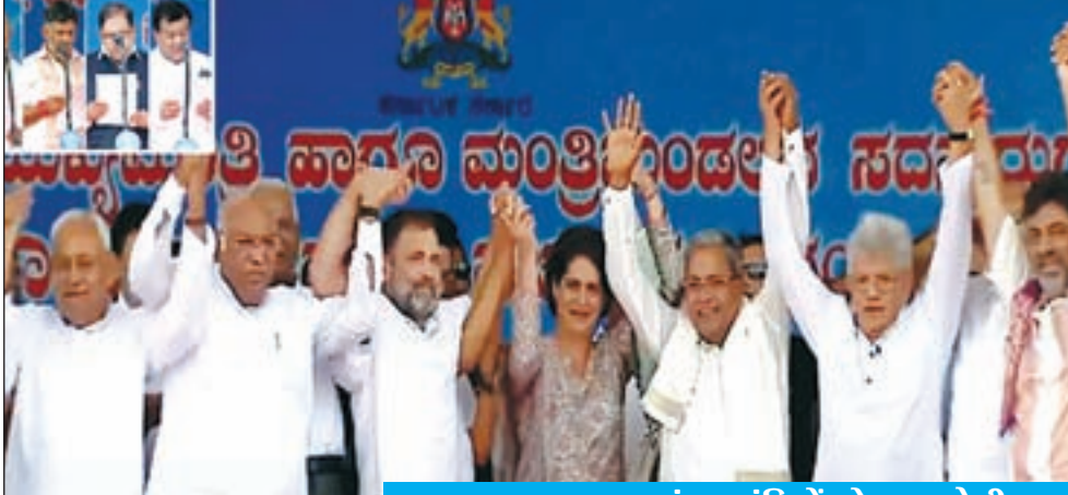
भ्रष्टाचार मुक्त सरकार पांच गारंटियों को पूरा करेगी: राहुल

बेंगलुरु : श्री सिद्धारमैया शनिवार को यहां कर्नाटक के मुख्यमंत्री और श्री डीके शिवकुमार ने उपमुख्यमंत्री पद की शपथ ली। राज्यपाल थावरचंद गहलोत ने श्री कांतिरवा स्टैंडियम में एक मेगा शपथ ग्रहण समारोह में उन्हें पद एवं गोपनीयता की शपथ दिलायी। पचहत्तर वर्षीय श्री सिद्धारमैया का 2013 के अपने पहले पांच साल के कार्यकाल के बाद मुख्यमंत्री के रूप में यह दूसरा कार्यकाल है, जबकि 61 वर्षीय शिवकुमार ने पहले श्री सिद्धारमैया के अधीन मंत्री के रूप में काम किया था। श्री शिवकुमार 2024 के लोकसभा चुनाव तक कर्नाटक कांग्रेस के अध्यक्ष भी बने रहेंगे। श्री सिद्धारमैया और श्री शिवकुमार के साथ आठ विधायकों ने भी मंत्री पद की शपथ ली। इन मंत्रियों के नाम हैं, जी परमेश्वर (एससी), केएच मुनियप्पा (एससी), केजे जॉर्ज (अल्पसंख्यक-ईसाई), एनवी पाटिल (लिंगायत), सतीश चारकीहोली