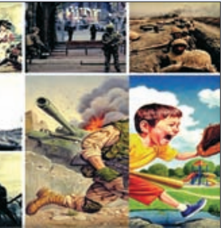
राष्ट्रीय आतंकवाद विरोधी दिवस (21 मई) पर विशेष

संबोधित करने गए थे, जहां लिट्टे से संबंधित एक महिला आतंकी अपने कपड़ों में विस्फोटक छिपाकर उनके पैर छूने के बहाने नीचे झुकी तो जबरदस्त बम धमाके में राजीव गांधी सहित करीब 25 लोगों की मौत हो गई थी। राजीव गांधी की हत्या के बाद तत्कालीन वी.पी. सिंह सरकार द्वारा 21 मई को आतंकवाद विरोधी दिवस के रूप में मनाने का निर्णय लिया गया। इस दिवस को मनाने का अहम उद्देश्य यही है कि देश में आतंकवाद, हिंसा के खतरे और उनके समाज, लोगों तथा देश पर पड़ने वाले खतरनाक असर के बारे में लोगों में जागरूकता बढ़ाई जाए। इस दिन सरकारी कार्यालयों, उपक्रमों तथा अन्य संस्थानों में आतंकवाद विरोधी शपथ यही दिलाई जाती है कि हम भारतवासी अपने देश की अहिंसा एवं सहनशीलता की परम्परा में दृढ़ विश्वास रखते हैं तथा निष्ठापूर्वक शपथ लेते हैं कि हम सभी प्रकार के आतंकवाद और हिंसा का उद्वेग विरोध करेंगे। हम मानव जाति के सभी वर्गों के बीच शांति, सामाजिक सद्भाव तथा सुलभ कस्यम रखने और मानव जीवन मूल्यों को खतरा पहुंचाने वाली विध्वंसकारी शक्तियों से लड़ने की भी शपथ लेते हैं। हालांकि पिछले कुछ वर्षों से देश में आतंकवादियों की कमर तोड़ने के लिए जिस तरह के सख्त कदम उठाए जा रहे हैं, उनके चलते देशभर में आतंकी घटनाओं में कमी दर्ज की जा रही है लेकिन विशेषकर जम्मू कश्मीर में अभी भी पाकिस्तान के पाले-पोसे भाड़े के टट्टू मासूम लोगों के खून से होली खेलने को लालायित रहते हैं किन्तु हमारे जांबाज सुरक्षा बल लगभग आए दिन, शोषियां हो या