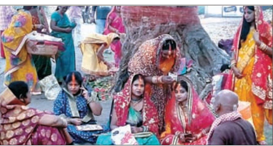
धींगे हुए चने, आटे की बनी मिठाई, कुमकुम, रोली, पांच प्रकार के फल, पान का पत्ता, धूप, दीप और बांस का पंखा लेकर नजदीकी वट वृक्ष के पास पहुंचीं और पूजा अर्चना की। वट वृक्ष को पूजने के लिए महिलाओं ने अपनी मान्यता के अनुसार 5, 7, 11, 21, 51, और 101 बार वट वृक्ष की परिक्रमा कर उसमें सूत बांधा। महिलाओं ने आशीर्वाद के रूप में वट वृक्ष के पत्ते को अपनी चोटों में सजाया। महिलाओं ने एक-दूसरे को सिंदूर लगाया। इसके बाद पुजारी से वट वृक्ष के नीचे ही सावित्री-सत्यवान की कथा सुनी। सावित्री ने यमराज से हट कर वट वृक्ष के नीचे ही अपने पति की जान बचाई थी। घर आकर महिलाओं ने पति के चर पधारें, शर्बत-पानी दिया और बेनी (बांस से बने पंखे) झेले। कई महिलाओं ने शुक्रवार को पूरे दिन उपवास रहकर व्रत रखा।

कोडरमा : कोडरमा में शुक्रवार की सुबह अखंड सुहाग के लिए महिलाओं ने जगह-जगह वट सावित्री पूजा की। कोडरमा में महिलाएं समूह में निकलीं और और विधि विधान से बरगद के पेड़ पर पूजा कर प्रसाद चढ़ाया। पुजारियों को दान दक्षिणा भी दिया। व्रती महिलाओं ने 108 बार बरगद की परिक्रमा की। शहर के थाना परिसर, ध्वजाचारी, कोडरमा बाजार सहित सभी मुहल्लों में महिलाएं हाथ में पूजा की थाली व जल लेकर प्रसाद के रूप में थाली में गुड़,