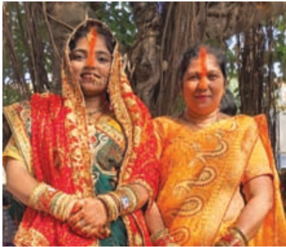
दान दिया। पूजा के बाद बट वृक्ष के तने में कच्चा सुता लपेटकर परिक्रमा की। ताड़ के पंखे से वट वृक्ष को हिला कर अपने पतिदेव के सुखमय जीवन की कामना की।

गया : ज्येष्ठ मास अमावस्या के अवसर पर शुक्रवार को अखंड सौभाग्य के लिए सुहागिन स्त्रियों ने अपने पति को सुख-समृद्धि और लंबी उम्र की कामना के लिए वट सावित्री का व्रत रखा। भीषण गर्मी के बीच दिनभर उपवास रखकर स्त्रियां वट वृक्ष की विशेष पूजा अर्चना करने में मशगूल दिखे। बट सावित्री पूजा को लेकर महिलाओं में विशेष उत्साह और उल्लास देखा गया। रंग-बिरंगे परिधानों में सोलह श्रृंगार से युक्त होकर महिलाएं हाथों में पूजा की थाली पूजन सामग्री और मौसमी फल आम, लीची, केला, खरबूजा, तरबूज, ककड़ी, बताशा, चना लिए बरगद के पेड़ के पास पहुंचीं, जहां बट सावित्री की कथा सुनकर ब्राह्मणों को यथासंभव सुहाग की पिटाई, फल पंखा और वस्त्रों का