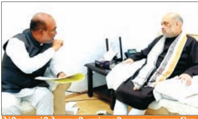
केंद्रीय गृह मंत्री ने राज्य की अखंडता की रक्षा का आश्वासन दिया

गुवाहाटी : मणिपुर में गत तीन मई को हुई हिंसा के बाद खाद्य आपूर्ति को रोक दिये जाने के बाद लोग लगभग भूखमरी के कगार पर पहुंच गये हैं। इम्फाल के लगभग सभी व्यापारियों और आपूर्तिकर्ताओं ने कहा कि स्टॉक में अनाज, दाल, खाद्य तेल, आलू आदि नहीं है। मणिपुर सरकार पिछले कुछ दिनों से भोजन और पेट्रोलियम उत्पादों के ट्रकों को लाने की कोशिश कर रही है। कांगपोकपी जिले में अधिकांश ट्रकों को लूट लिया गया और वाहनों को जला दिया गया और इसलिए सभी ट्रक चालक जिले में वापस आ गए। मणिपुर मानवीय संकट का सामना कर रहा है और आवश्यक वस्तुएं प्रदान करने के लिए केंद्र से अभी तक कोई हस्तक्षेप नहीं हुआ है। इम्फाल से माओ राजमार्गों को ज्यादातर समय कुछ