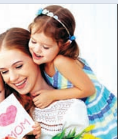
14 मई मर्दस डे पर विशेष

मां ही लय, मां ताल है, जीवन की झंकार !! मां ही गीता, वेद है, मां ही सच्ची प्रीत ! बिन मां के झूठी लगे, जग की सारी रीत !! मां हरियाली दूब है, शीतल गंग अनूप ! मुझमें तुझमें बस रहा, मां का ही तो रूप !! कोई भी चोट पहले मां को लगती है फिर बच्चे को। मां के प्यार का कर्ज चुकाया नहीं जा सकता। बच्चा चाहें कितना भी बड़ा हो जाए मां का आँचल उसे सबसे सुरक्षित महसूस होता है। तो उस माँके लिए भी एक दिन उसका अपना होना आवश्यक हो जाता है। इसे लोकप्रिय बनाई अमेरिका की ऐना ने। जी हाँ, लाखों लोग इस दिन को मर्दस डेएक सुअवसर के रूप में मनाते हैं और अपनी मां को उनकेबलिदान, समर्थन, प्रयास के लिए दिल से धन्यवाद करते हैं। यही वजह है कि हर साल मई के