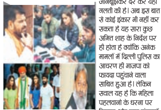
जानबूझकर देर कर रही गलती की है। अब इस बात से कोई इंकार भी नहीं कर सकता है यह सारा कुछ अमित शाह के निर्देश पर ही होता है क्योंकि अनेक मामलों में दिल्ली पुलिस का आचरण ही भाजपा को फायदा पहुंचाते आते आते साबित हुआ है। लेकिन सवाल यह है कि महिला पहलवानों के धरना पर किसान और खाप पंचायतों

पुरानी कहावत है कि गज यानी तीन फीट लंबा कपड़ा बचाने के चक्कर में कपड़े की पूरी थान ही लुटा देना। पहलवानों के धरना पर नरेंद्र मोदी और अमित शाह की बेरुखी इसी का संकेत देती है। यह दावा किया गया है कि कुश्ती महासंघ के अध्यक्ष के पास सात आठ लोकसभा और विधानसभा सीटों की चाबी है। अगर यह सही भी है तो जिस तरीके से इस घटना के बाद दिल्ली पुलिस के आचरण पर प्रतिक्रिया हुई है, उससे हरियाणा, पंजाब, राजस्थान और पश्चिमी उत्तरप्रदेश में भाजपा नेताओं को इसी मुद्दे पर फिर से खाली का सामना करना पड़ रहा है। यह दावा देना प्रासंगिक है कि नरेंद्र मोदी ने किसान आंदोलन के वक्त भी यही गलती की थी, जिसका नतीजा था कि भाजपा वाले गांवों में प्रवेश कर नहीं कर पा रहे थे। अंग्रेजी में एक ब्यापिक कहावत है और इसे बार बार अदालतों में दोहराया भी गया है कि जस्टिस डिलेड इज जस्टिस डिनाइड, यानी ब्यापिक में देर का अर्थ किसी को ब्याप से वंचित करना है। दिल्ली पुलिस ने बज्रभूषण के खिलाफ प्राथमिकी दर्ज करने में