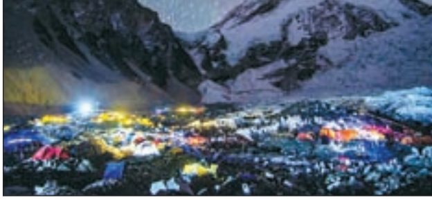
रात के वक्त सुनायी देती थी, यह वैज्ञानिकों की एक टीम ने शोर के स्रोत का पता लगाया।

नईदिल्ली: माउंट एवरेस्ट पर रात के समय अजीबोगरीब और रहस्यमयी आवाजें सुनाई देती हैं। इस आवाज को लेकर कई किस्म की कहानियाँ काफी समय से प्रचलित थीं। कुछ लोग तो इसे येती की आवाज भी कह देते थे जबकि येती एक ऐसा बफ़ीला प्राणी है, जिसे आज तक देखा नहीं गया है और विज्ञान अब तक उसे कल्पना ही मानता है। लेकिन माउंट एवरेस्ट पर अजीब किस्म की आवाज सिर्फ