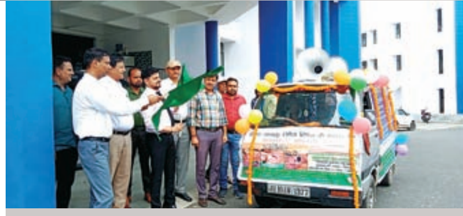
विश्व तंबाकू दिवस पर शपथ लिया, हस्ताक्षर अभियान चला

विभिन्न प्रखंडों में जाकर आमजनों को तंबाकू एवं इसके उत्पादों से होने वाले नुकसान से जागरूक करेंगी