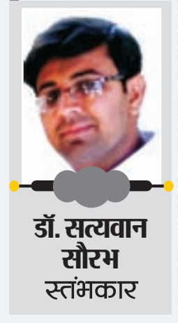
डॉ. सत्यवान सौरभ स्तंभकार

राज्य सरकार स्थानीय नौकरशाही के माध्यम से स्थानीय सरकारों को बाध्य करती हैं। उदाहरण के लिए, सार्वजनिक निर्माण परियोजनाओं के अनुमोदन के लिए अक्सर ग्रामीण विकास विभाग के स्थानीय अधिकारियों से तकनीकी स्वीकृति और प्रशासनिक अनुमोदन की आवश्यकता होती है, सरपंचों के लिए एक थकाऊ प्रक्रिया जिसके लिए सरकारी कार्यालयों में बार-बार जाने की आवश्यकता होती है। स्थानीय कर्मचारियों पर प्रशासनिक नियंत्रण रखने की सरपंचों की क्षमता सीमित है। कई राज्यों में, पंचायत को रिपोर्ट करने वाले स्थानीय पदाधिकारियों, जैसे ग्राम चौकीदार या सफाई कर्मचारियों, की भर्ती जिला या ब्लॉक स्तर पर की जाती है। अक्सर सरपंच के पास इन स्थानीय स्तर के कर्मचारियों को बर्खास्त करने की शक्ति भी नहीं होती है। आजकल हमें ऐसी खबरें सुनने और पढ़ने को मिल रही है कि देश के अमुक गांव के सरपंच ने कर्ज के चलते आत्महत्या कर ली। आखिर ऐसा क्यों हो रहा है? भारत की पंचायती राज प्रणाली में गांव या छोटे कस्बे के स्तर पर ग्राम पंचायत या ग्राम सभा होती है जो भारत के स्थानीय स्वशासन का प्रमुख अवयव है। सरपंच, ग्राम सभा का चुना हुआ सर्वोच्च प्रतिनिधि होता है। प्राचीन काल से ही भारतवर्ष के सामाजिक, राजनीतिक और आर्थिक