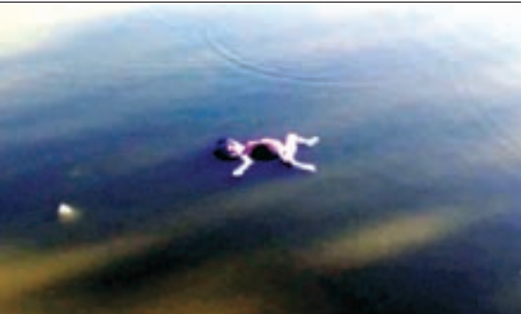
इससे पूर्व भी कुडू में लावारिशा हालत में मिले हैं बच्चे

राष्ट्रीय खबर कुडू : कुडू प्रखंड क्षेत्र के बढकी चापी गाँव के गुरुवार 21 अप्रैल को सुबह ममता की छंव से महरूम एक नवजात शिशु का तैरता शव बढकी चापी छठ तालाब में तैरता पाया गया। नवजात का शव देखने से ऐसा प्रतीत हो रहा था कि जन्म के बाद ऐसे तालाब में फेंक दिया गया हो। नवजात का शव मिलने की खबर गाँव में आग की तरह फैल गयी। और देखते ही देखते भारी संख्या में ग्रामीण महिला पुरुष छठ तालाब पहुंच गए। अंदाजा लगाया जा रहा है कि