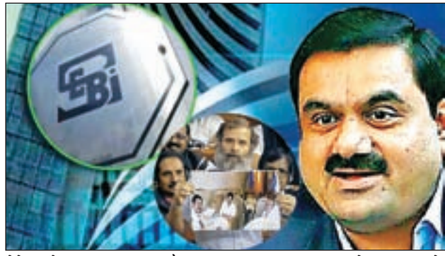
लेने वालों की जानकारी नहीं है। पूंजी बाजार नियामक ने सूचना के