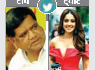
जगन्मोहन रेड्डी कर्नाटक के पूर्व मुख्यमंत्री

“मुझे उस पार्टी से जबरन बाहर निकाला गया जिसे मैंने बनाया था। मैं कांग्रेस की विचारधारा और सिद्धांतों को स्वीकार करते हुए उसमें शामिल हो रहा हूँ।”