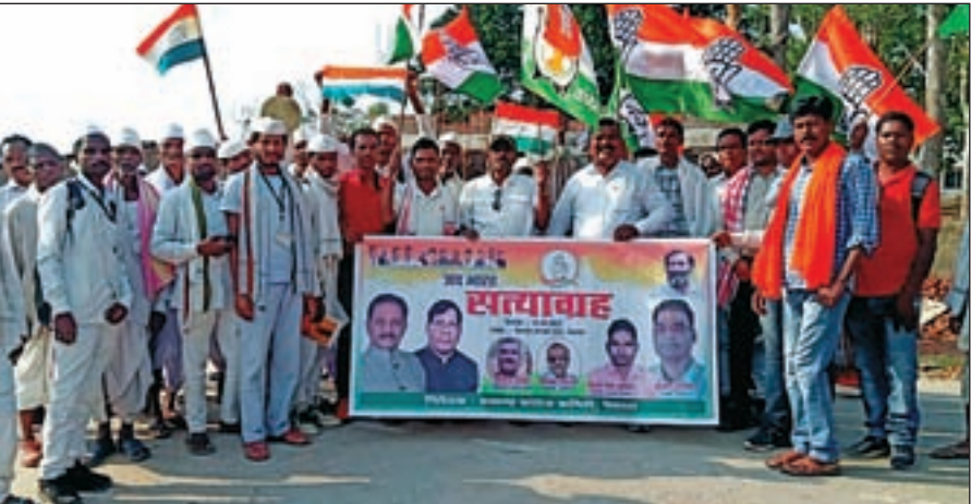
बेरोजगारी, अडानी, निरव मोदी, जैसे व्यापारी देश का पैसा लेकर भागे है गरीबों का पैसा डुबाया है मनीय नेता राहुलगान्धी सदन में सवाल पुछते है न्यूसे जांच की मांग की इससे डर कर केंद्र की