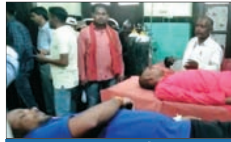
कोई शराब पीएगा तो मरेगा-उदाहरण हमारे सामने है: नीतीश कुमार

पटना: बिहार में शुक्रवार रात अवैध शराब पीने से 20 लोगों की मौत हो गयी है, जबकि आधा दर्जन लोगों को गंभीर हालत में अस्पताल में भर्ती कराया गया है। त्रासदी, 2016 के बाद से ऐसी मौतों की श्रृंखला में नवीनतम, जब बिहार सरकार ने राज्य में शराब पर प्रतिबंध लगा दिया था। राज्य की राजधानी पटना से लगभग 150 किलोमीटर उत्तर-