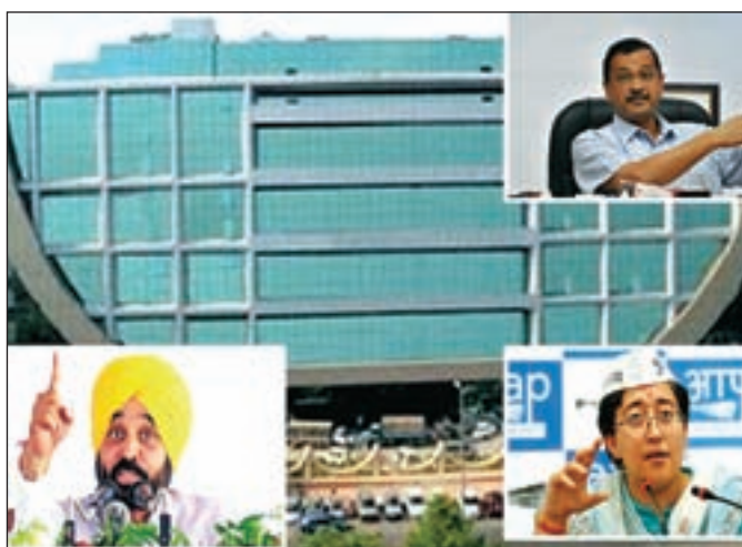
केंद्र सरकार केजरीवाल की आवाज दबाना चाहती है: आतिशी

चंडीगढ़: केन्द्रीय जांच ब्यूरो (सीबीआई) द्वारा आम आदमी पार्टी (आप) संयोजक अरविंद केजरीवाल को पूछताछ के लिए बुलाए जाने पर आप नेताओं ने तीखी प्रतिक्रिया व्यक्त की है। मुख्यमंत्री भगवंत मान, कई कैबिनेट मंत्री और विधायकों ने इसे केंद्र सरकार का तानाशाही भरा फैसला बताया और कहा कि श्री केजरीवाल क्रांतिकारी नेता हैं। नरेंद्र मोदी सरकार, प्रवर्तन निदेशालय (ईडी) और केन्द्रीय जांच ब्यूरो (सीबीआई) उन्हें झुका नहीं सकती। मुख्यमंत्री भगवंत मान ने ट्वीट कर कहा, अरविंद केजरीवाल जी की आवाज को दबाना बहुत मुश्किल है। सत्य बोलने वाले लोगों के दिल में जगह बनाते हैं। उन्हें लोगों के दिलों से कोई किसी को डिलीट नहीं कर सकता। हम चट्टान की तरह उनके साथ खड़े हैं। इंकलाब जिंदाबाद। वित्त मंत्री हरपाल सिंह चीमा ने कहा, अरविंद केजरीवाल ने अड़ानी और भारतीय