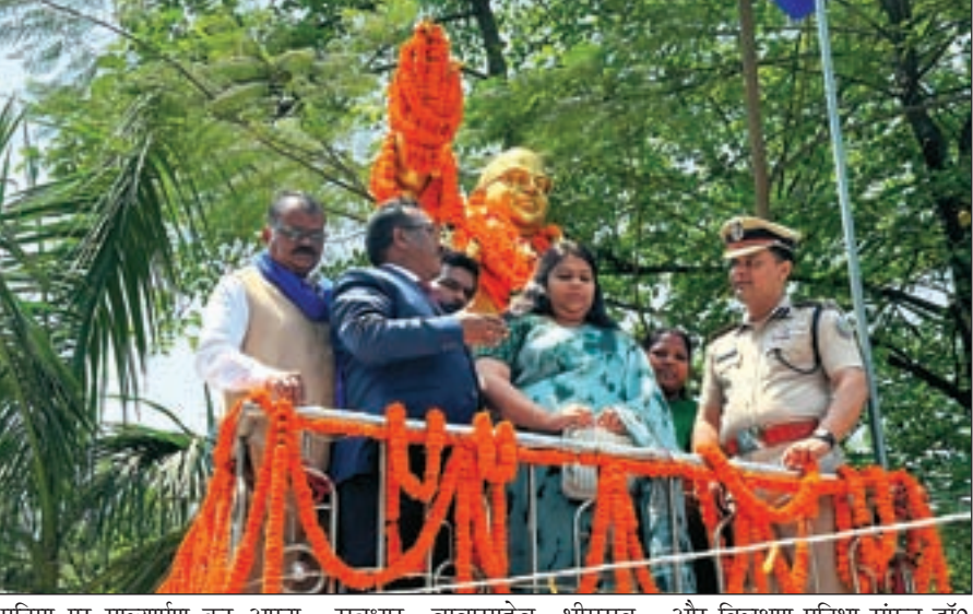
प्रतिमा पर माल्यार्पण कर अपना सम्मान प्रकट किया। मौके पर उन्होंने कहा कि संविधान के

अंबेडकर जयंती के अवसर पर उपायुक्त व पुलिस अधीक्षक ने जिलेवासियों को दी बधाई बाबा साहब अम्बेडकर के विचारों, आदर्शों को विधार्थी जीवन में आत्मसात करना आवश्यक है। पुलिस अधीक्षक : मनोज रतन